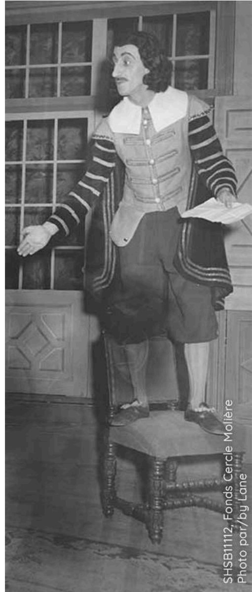
SHSB1112, Fonds Cercle Molière Photo par/by Lane

Le personnage d' Harpagon , représenté sur la photo, est méfiant, grognon, et toujours inquiet qu'on veuille lui prendre ce qu'il possède.