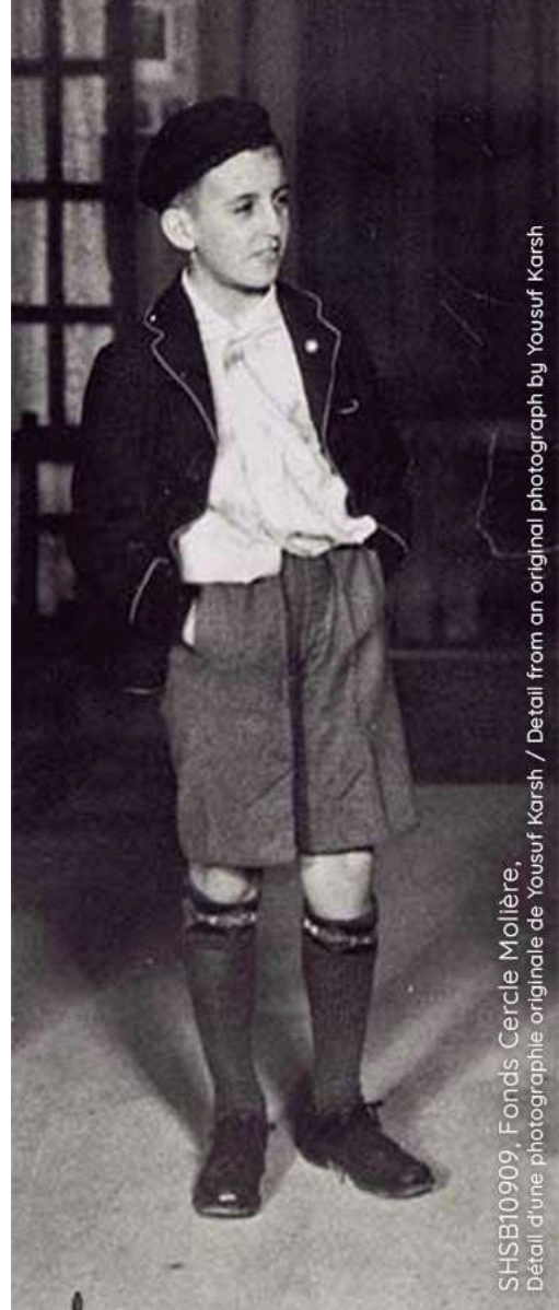
SHSB10909, Fonds Cercle Molière