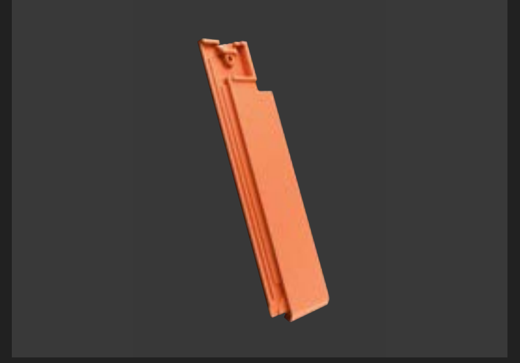
Половинчаста черепиця – для акуратного завершення рядів.