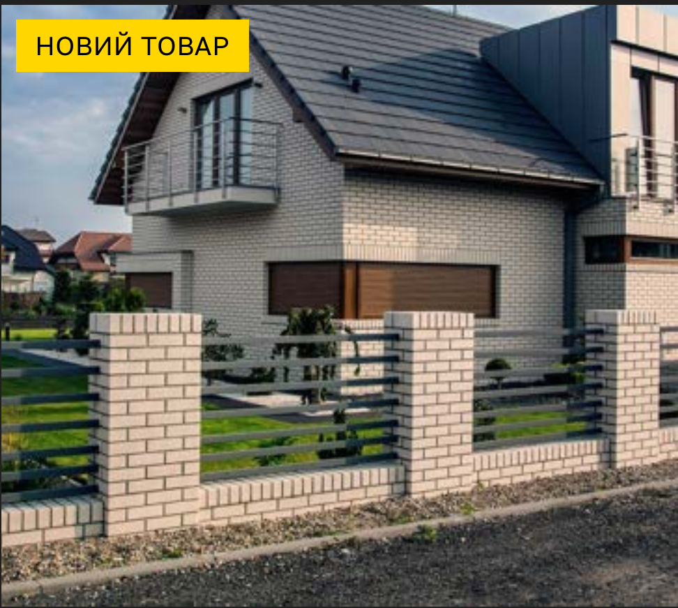
Roben Bergamo - Плоска Черепиця