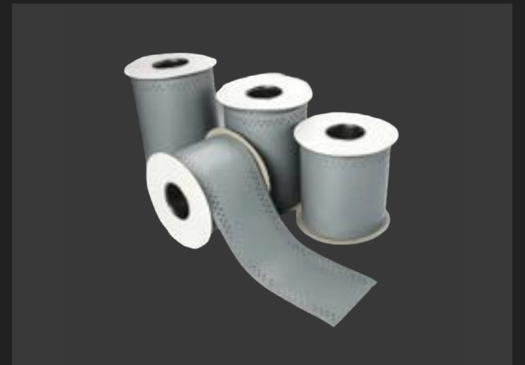
Стрічки й ущільнювачі – для герметизації стиків.