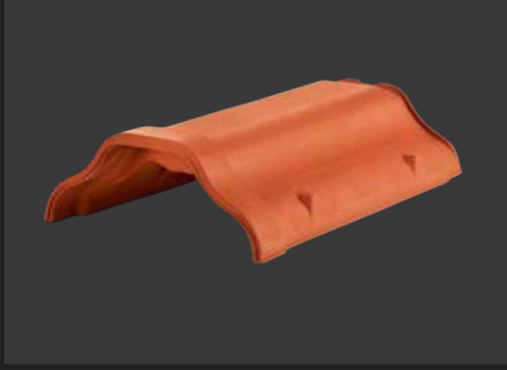
Конькова черепиця – захист гребеня даху.