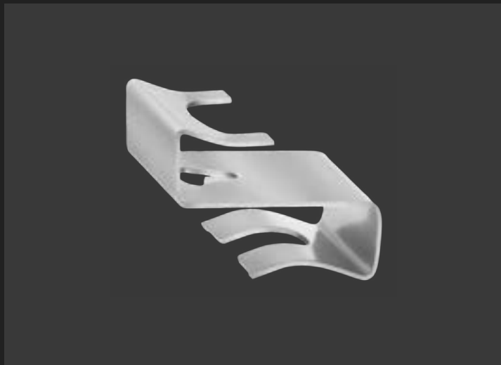
Кріплення та затискачі – проти сповзання черепиці.