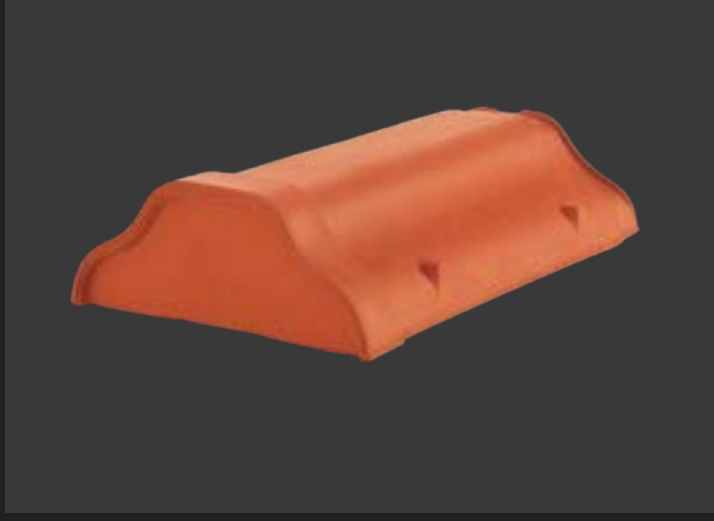
Початкова черепиця – рівний стартовий край.

Комплектуючі забезпечують герметичність, вентиляцію і гарний вигляд вашої покрівлі: