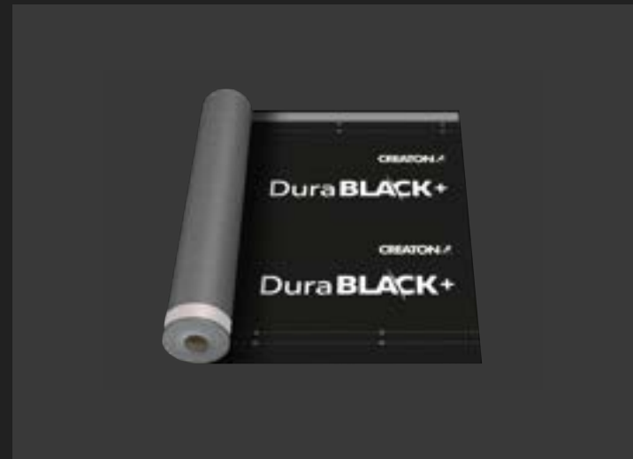
Гідроізоляційна мембрана – додатковий захист від води.