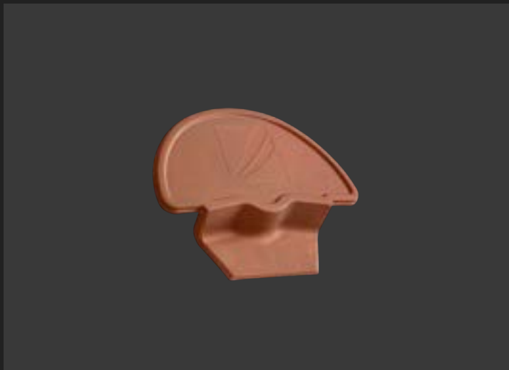
Вальмова черепиця – для кутових зон даху.