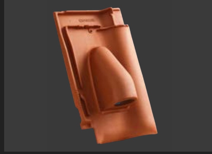
Вентиляційна черепиця – циркуляція повітря і запобігання вологи.