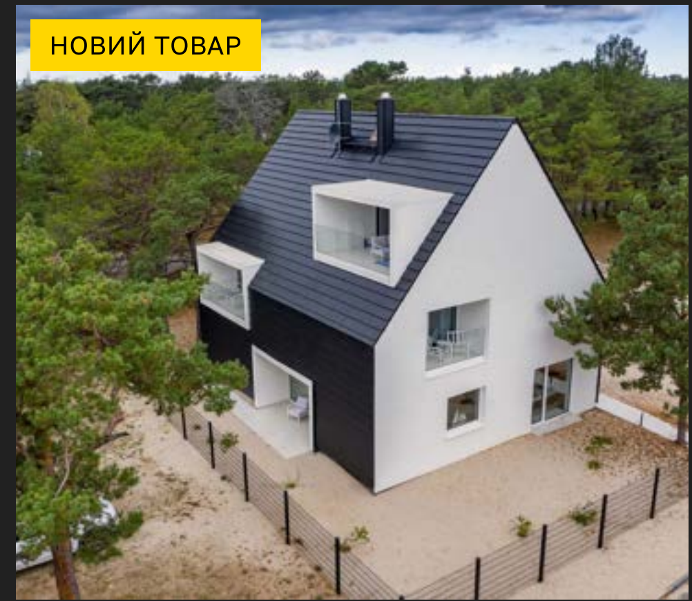
CREATON DOMINO - Пазова Черепиця