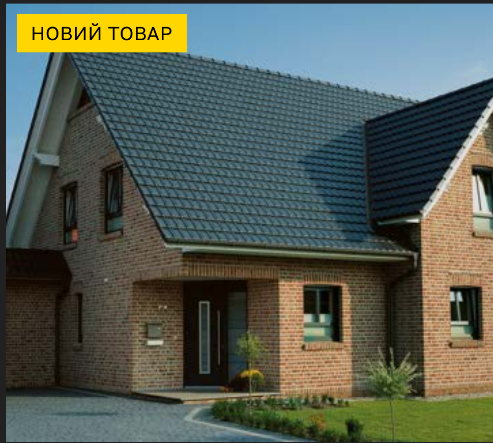
Roben MONZA - S-подібна Черепиця