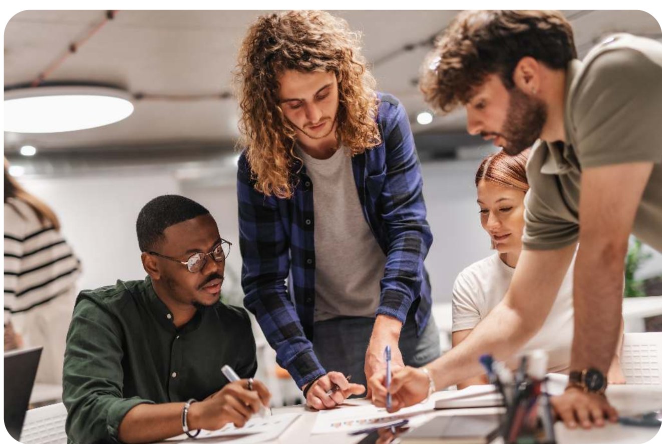
Consultoria e Treinamento Personalizado