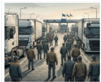
Rallenta ma non si ferma la protesta dei camionieri Balcani