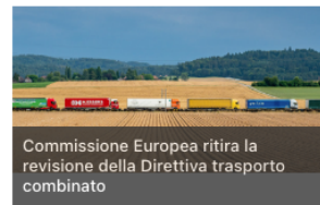
Commissione Europea ritira la revisione della Direttiva trasporto combinato