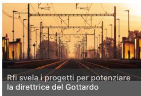
Rfi svela i progetti per potenziare la direttrice del Gottardo