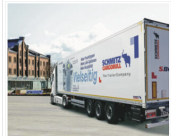
Nuovo semirimorchio Schmitz, con uno sguardo all'America