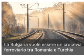
La Bulgaria vuole essere un crocevia ferroviario tra Romania e Turchia