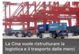
La Cina vuole ristrutturare la logistica e il trasporto delle merci