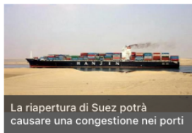
La riapertura di Suez potrà causare una congestione nei porti