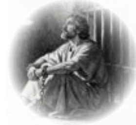
Pablo ● Apóstol, ciudadano romano. ● Preso desde Hechos 24.