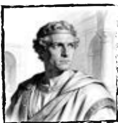
Herodes Agripa II

Rey cliente de Roma (≈ 50-100 d.C.) Experto en asuntos judíos.