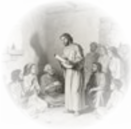
Iglesia primitiva (33–46 d.C.): Expansión del evangelio.