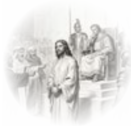
Jesús (30–33 d.C.): Juicio, crucifixión, resurrección.

Si entendemos Hechos 25 sin contexto, vemos solo un juicio. Pero al ver la historia completa, aparece un patrón. El evangelio siempre se pone en juicio.