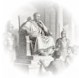
Festo (Porcio Festo) ● Procurador romano de Judea (≈ 59–62 d.C.). ● Sustituye a Félix. ● Conocido por intentar gobernar con más justicia, pero políticamente pragmático.