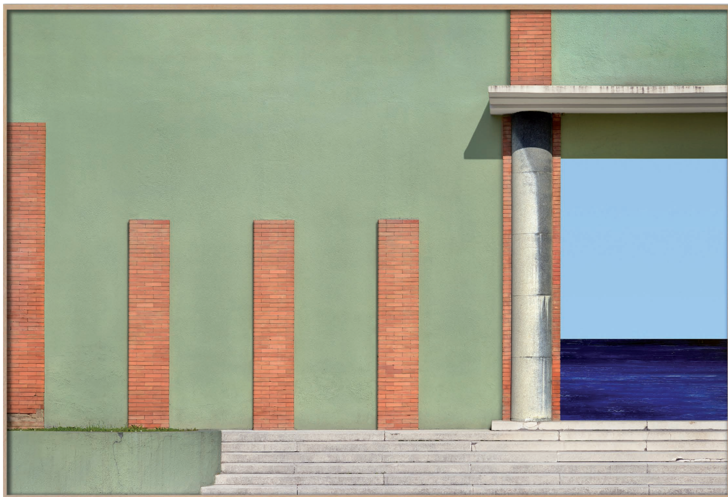
TRESIGALLO 3 , 2025 Impression jet d'encre sur papier coton Hahnemühle, émail satiné à base d'eau 80 x 120 cm | 81.6 x 122 x 4.5 cm (Cadre) Édition : 3 + 2 EA