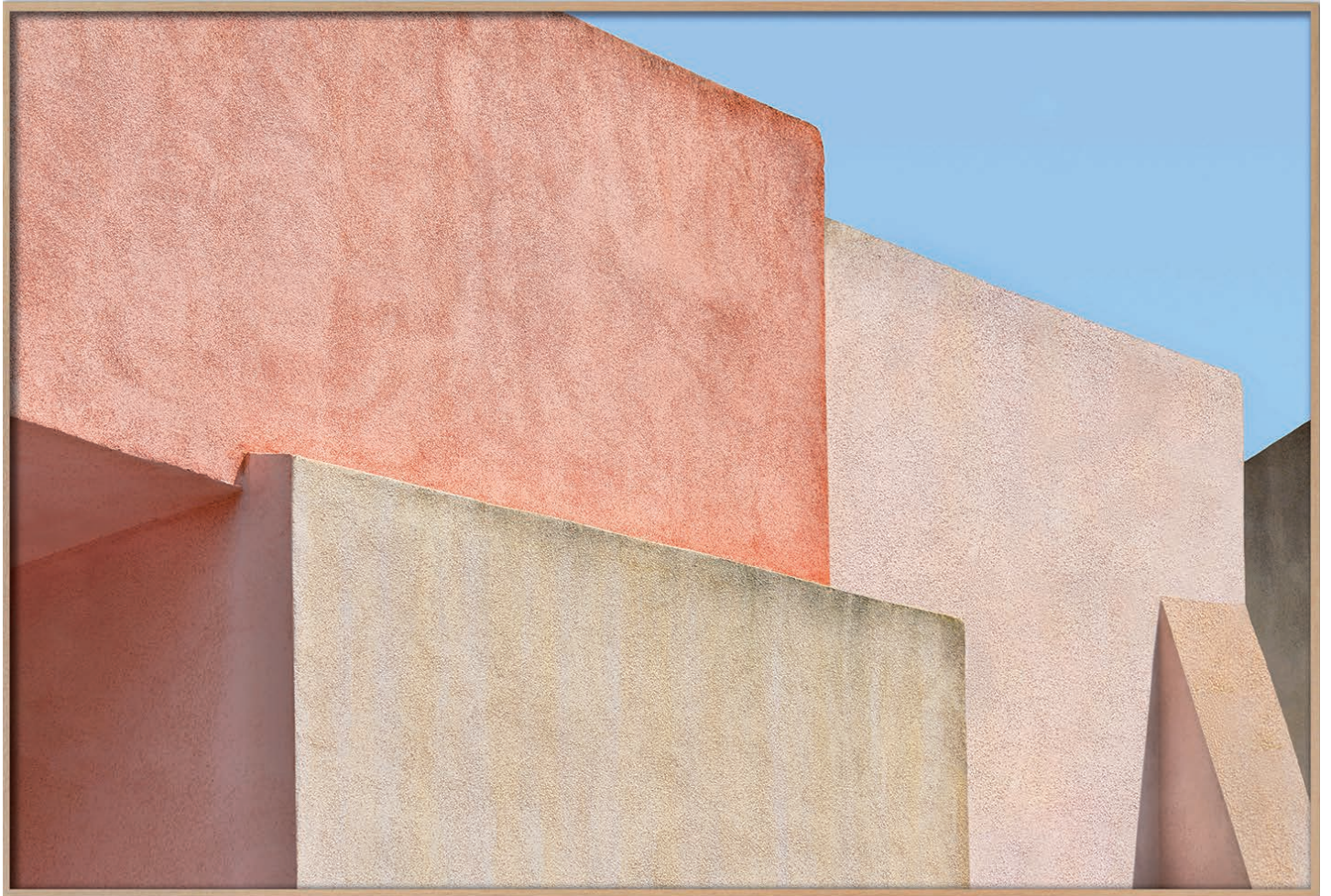
PANTELLERIA PAESE 45 , 2026 Impression jet d'encre sur papier coton Hahnemühle 100 x 150 cm | 102.8 x 152.8 x 4.5 cm (Cadre) Édition : 3 + 2 EA