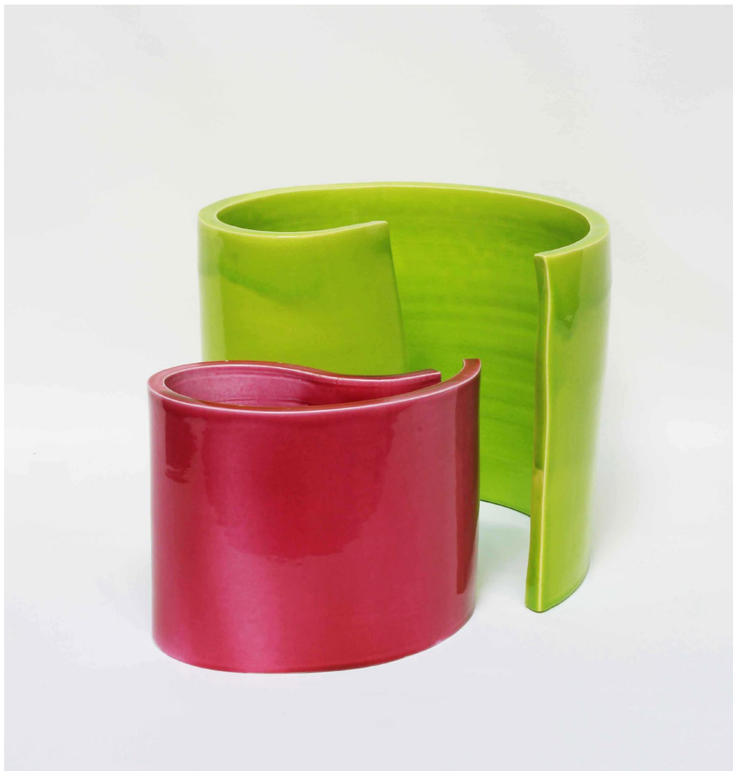
Alberto Cont Labirinto verde e rosa , 2006 Grès émaillé 30 x 44 x 30 cm Oeuvre unique