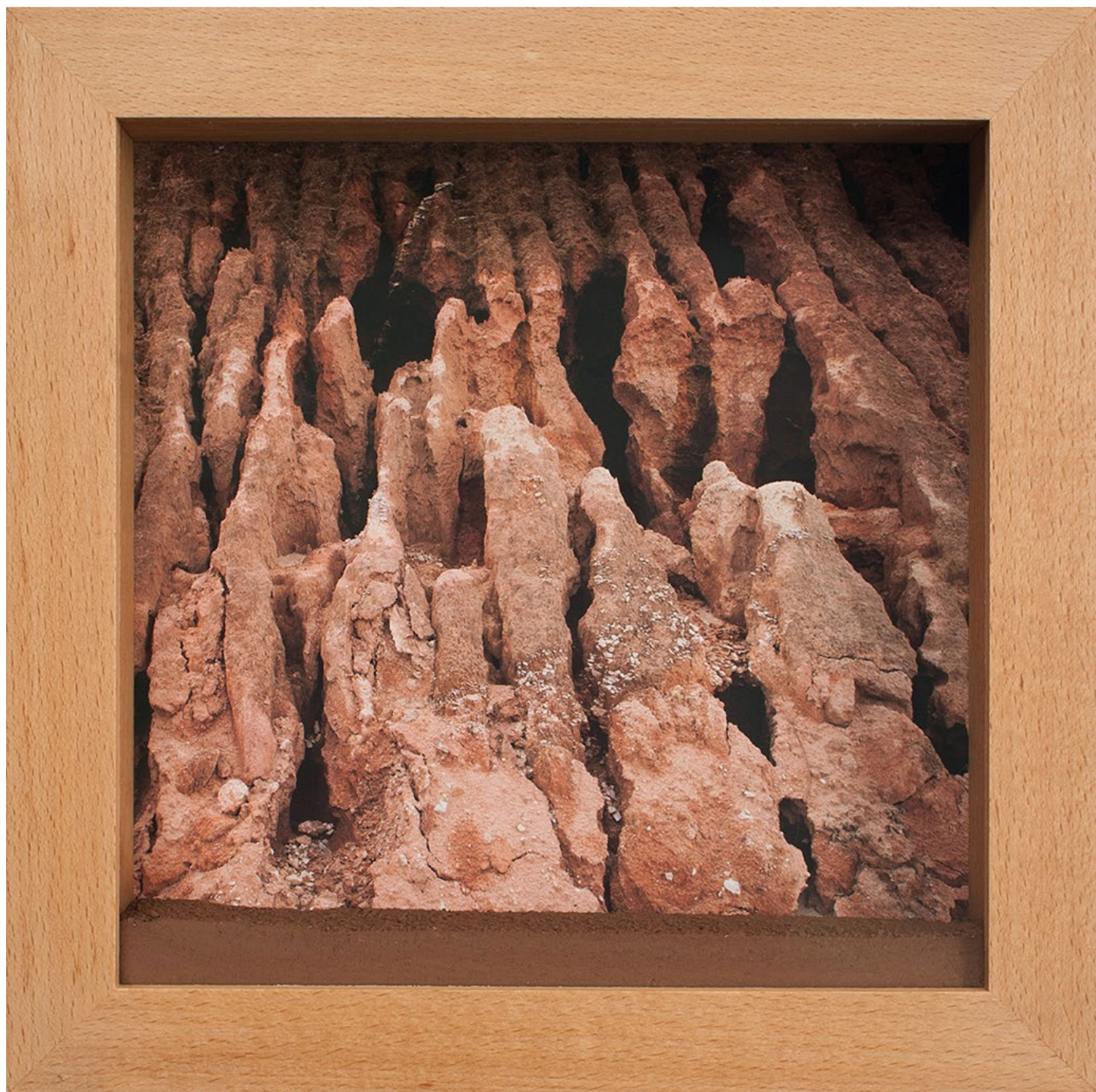
Pedro Motta Falência , 2018 Impression minérale sur papier coton et pigment minéral 42 x 42 x 7 cm Édition : 5+2 EA