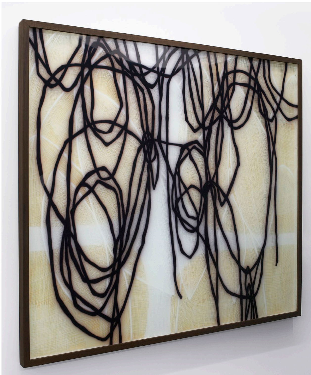
Julio Rondo PLUS DE LIAISON , 2008 Acrylique sous verre 154 x 180 x 6 cm Oeuvre unique