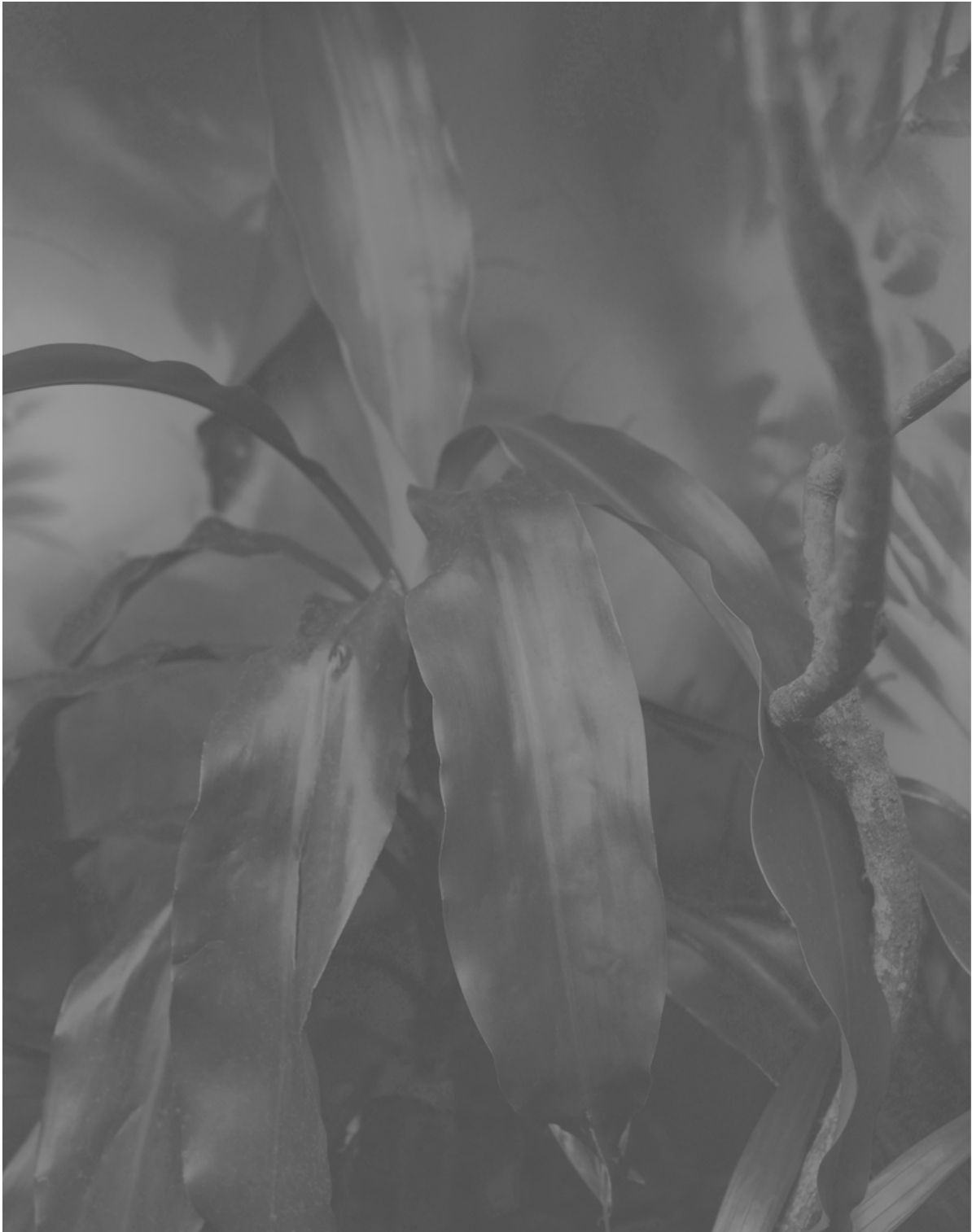
Caio Reisewitz planta cinza III (tudo que restou) , 2020 Impression chromogène 70 x 55 cm | 71.1 x 56.1 cm (Cadre) Édition : 5+2 EA