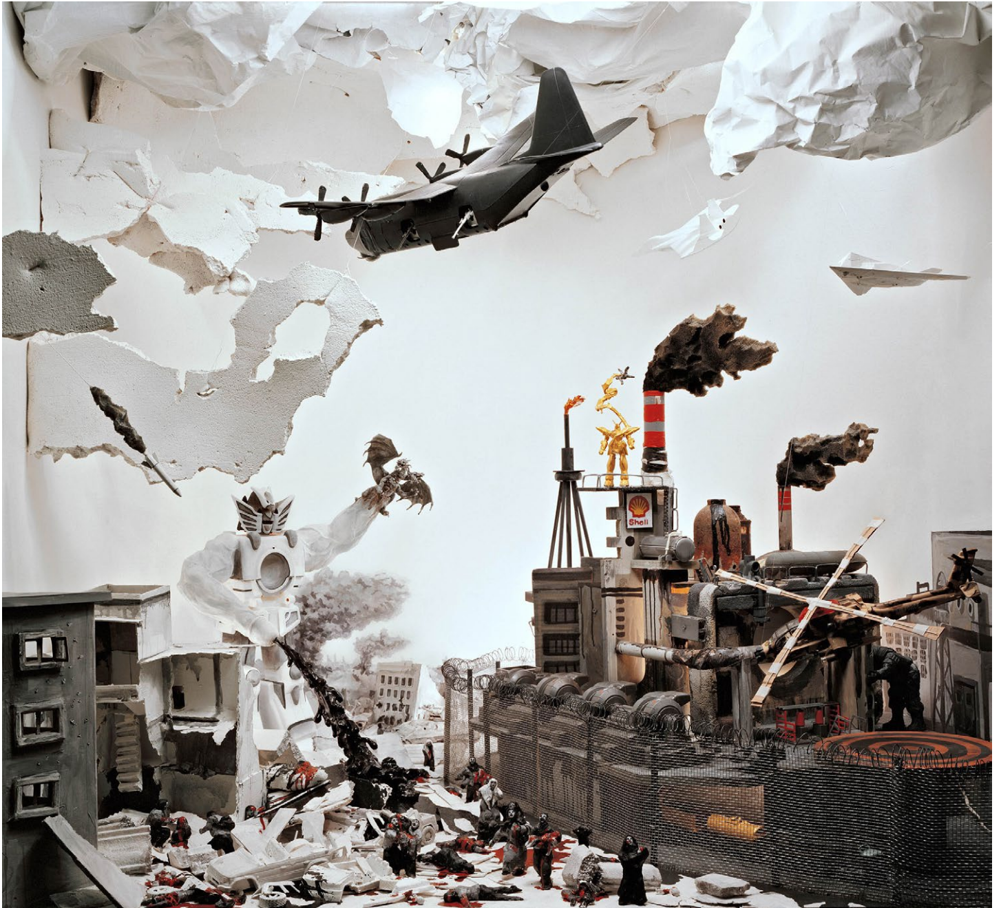
Norton Maza Architecture des ombres , 2009 Série : El delirio de los sabios Lambda Print 137 x 125 cm | 141.5 x 153.5 x 5 cm (Cadre) Édition : 3