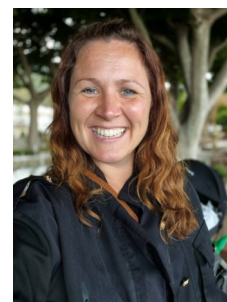
Dirigent Gult kurs