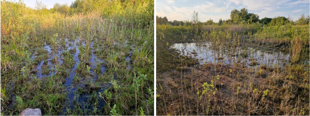
Søer nr. L8 og L7 med tilgroning af pil m.m.