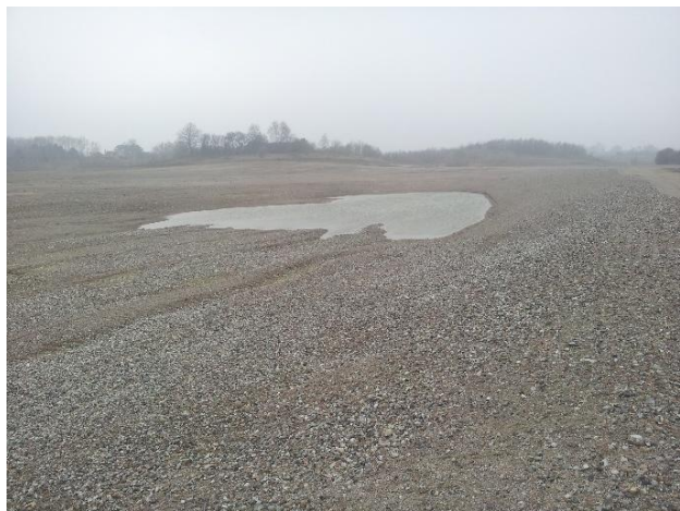
Sletten marts 2014 med de to L5 søer.