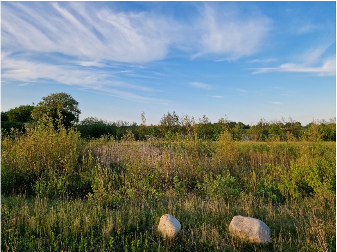
Sø nr. L6 er forsvundet i tilgroning.

Sletten er under stadig tilgroning med lave buske. For en pioner-art som strandtudse udvikler Sletten sig langsomt i en negativ retning grundet tilgroningen. Skrubtudse, butsnudet frø og salamandre er konkurrenter for strandtudsen og de arter trives godt i tilgroede miljøer. Arealet som strandtudsens fouragere på, skrumper år for år som følge af tilgroningen. Afgræsning af Sletten med køer, er meget