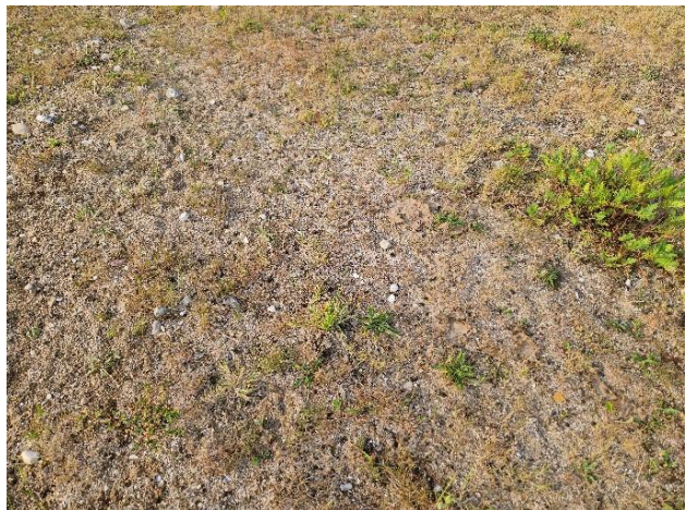
Omgivelser ved sø nr. L4.