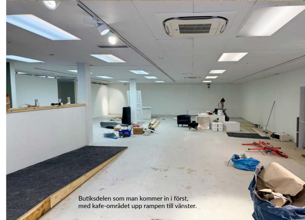
Butiksdelen som man kommer in i först, med kafe-området upp rampen till vänster.