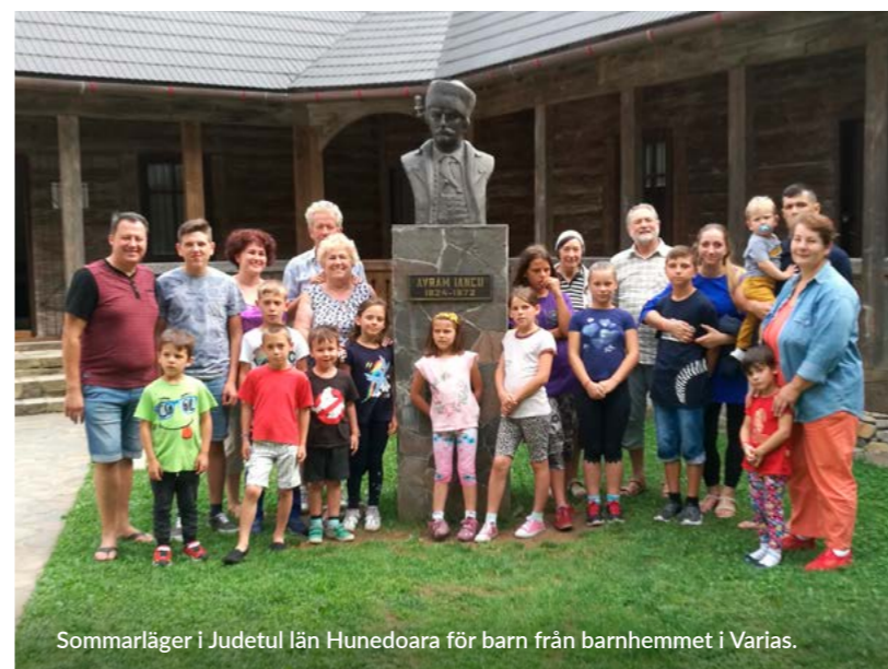
Sommarläger i Judetul län Hunedoara för barn från barnhemmet i Varias.