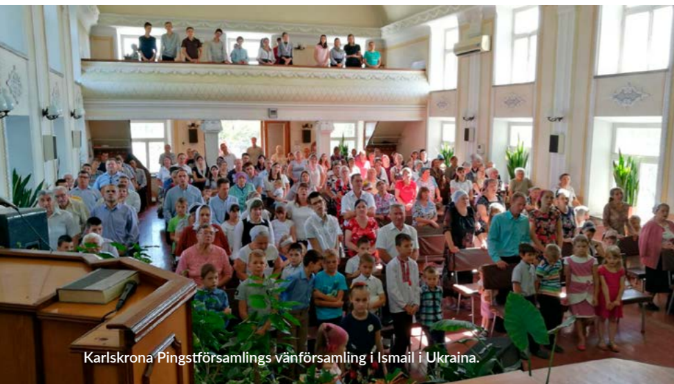
Karlskrona Pingstförsamlings vänförsamling i Ismail i Ukraina.