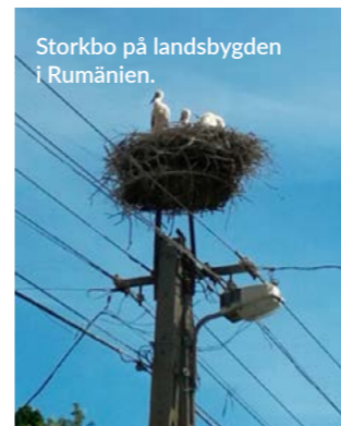
Storkbo på landsbygden i Rumänien.