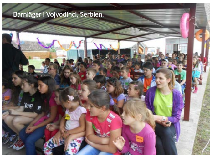
Barnläger i Vojvodinci, Serbien.