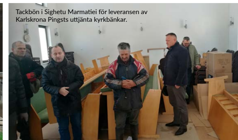
Tackbön i Sighetu Marmatiei för leveransen av Karlskrona Pingsts uttjänta kyrkbänkar.