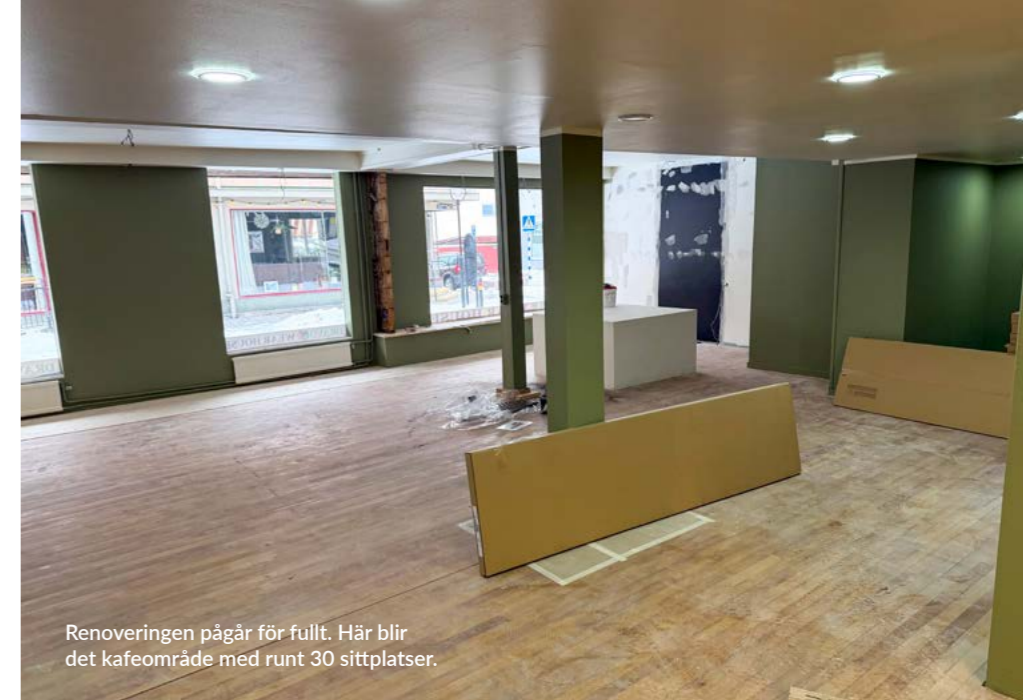
Renoveringen pågår för fullt. Här blir det kafeområde med runt 30 sittplatser.