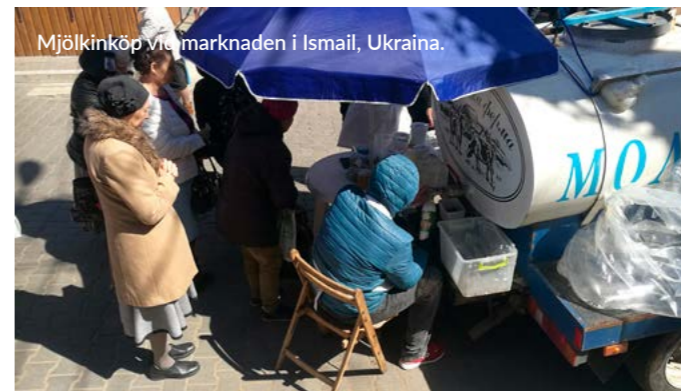
Mjölköp vid marknaden i Ismail, Ukraina.