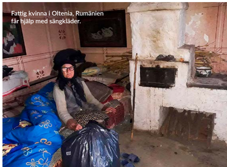
Fattig kvinna i Oltenia, Rumänien får hjälp med sängkläder.