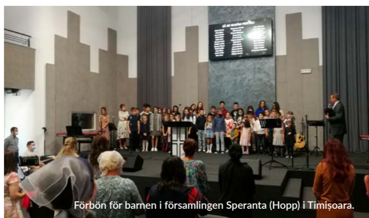
Förbön för barnen i församlingen Speranta (Hopp) i Timișoara.