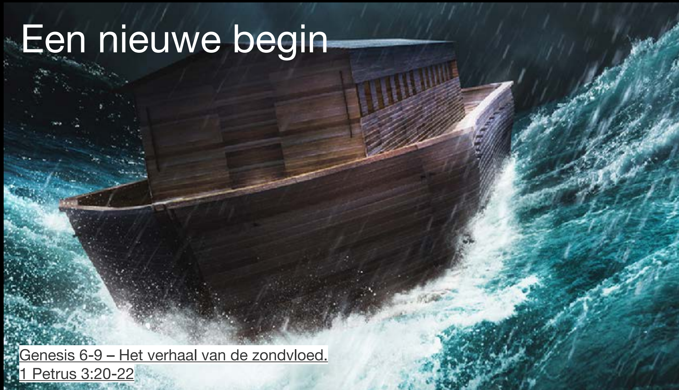
Genesis 6-9 – Het verhaal van de zondvloed. 1 Petrus 3:20-22