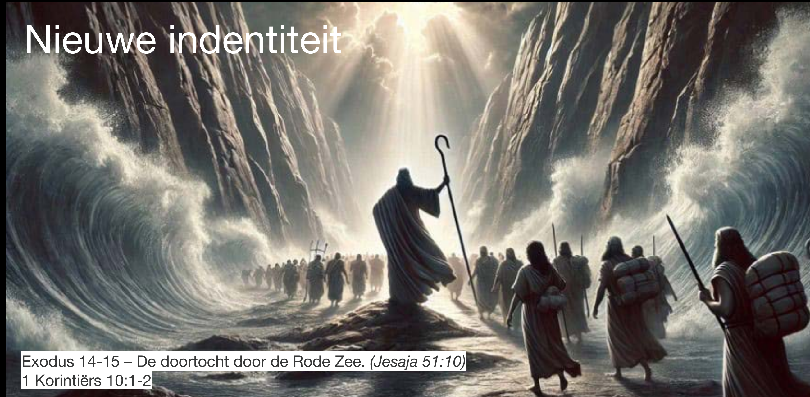
Exodus 14-15 – De doortocht door de Rode Zee. (Jesaja 51:10) 1 Korintiërs 10:1-2