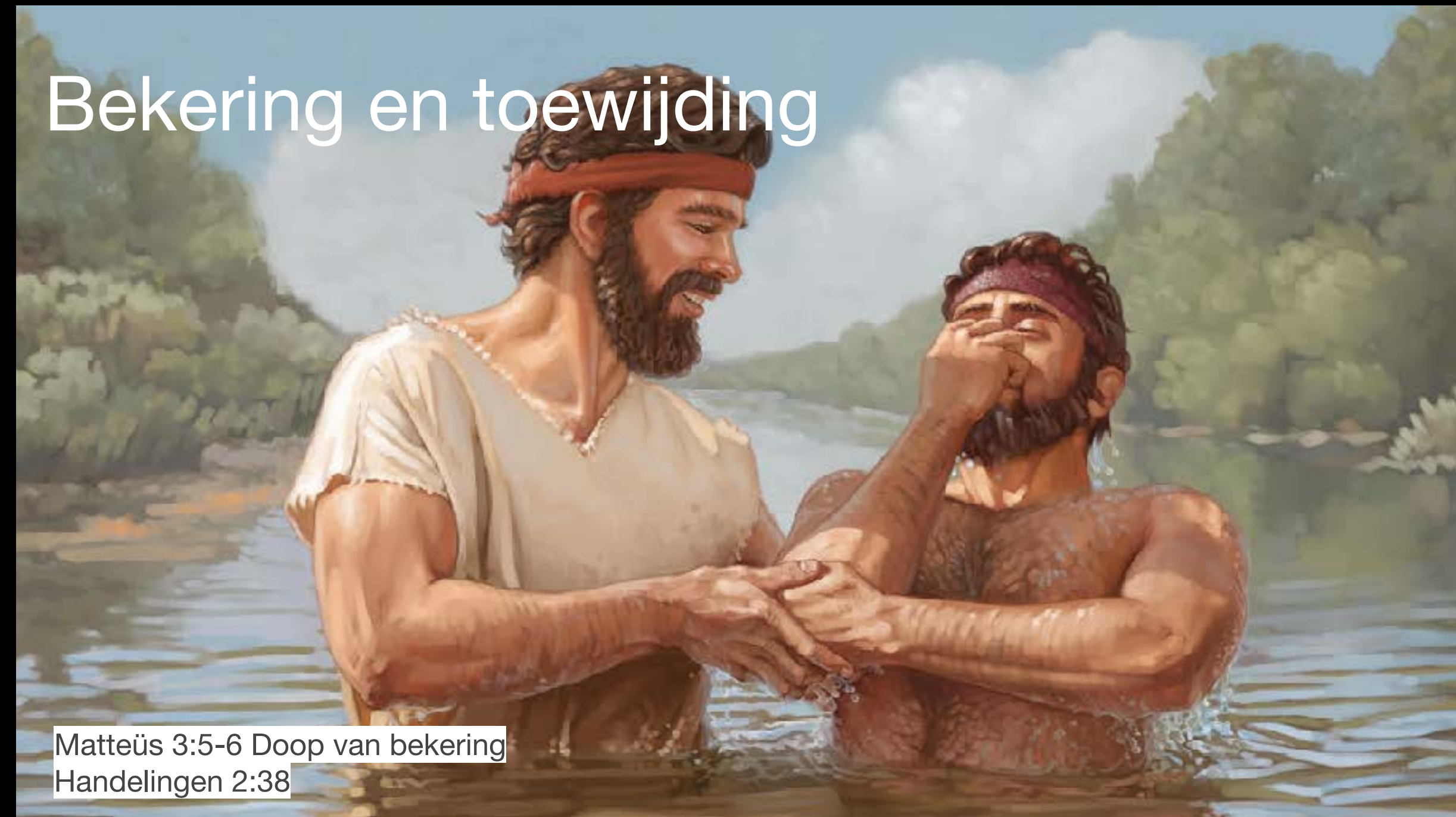
Matteüs 3:5-6 Doop van bekering Handelingen 2:38