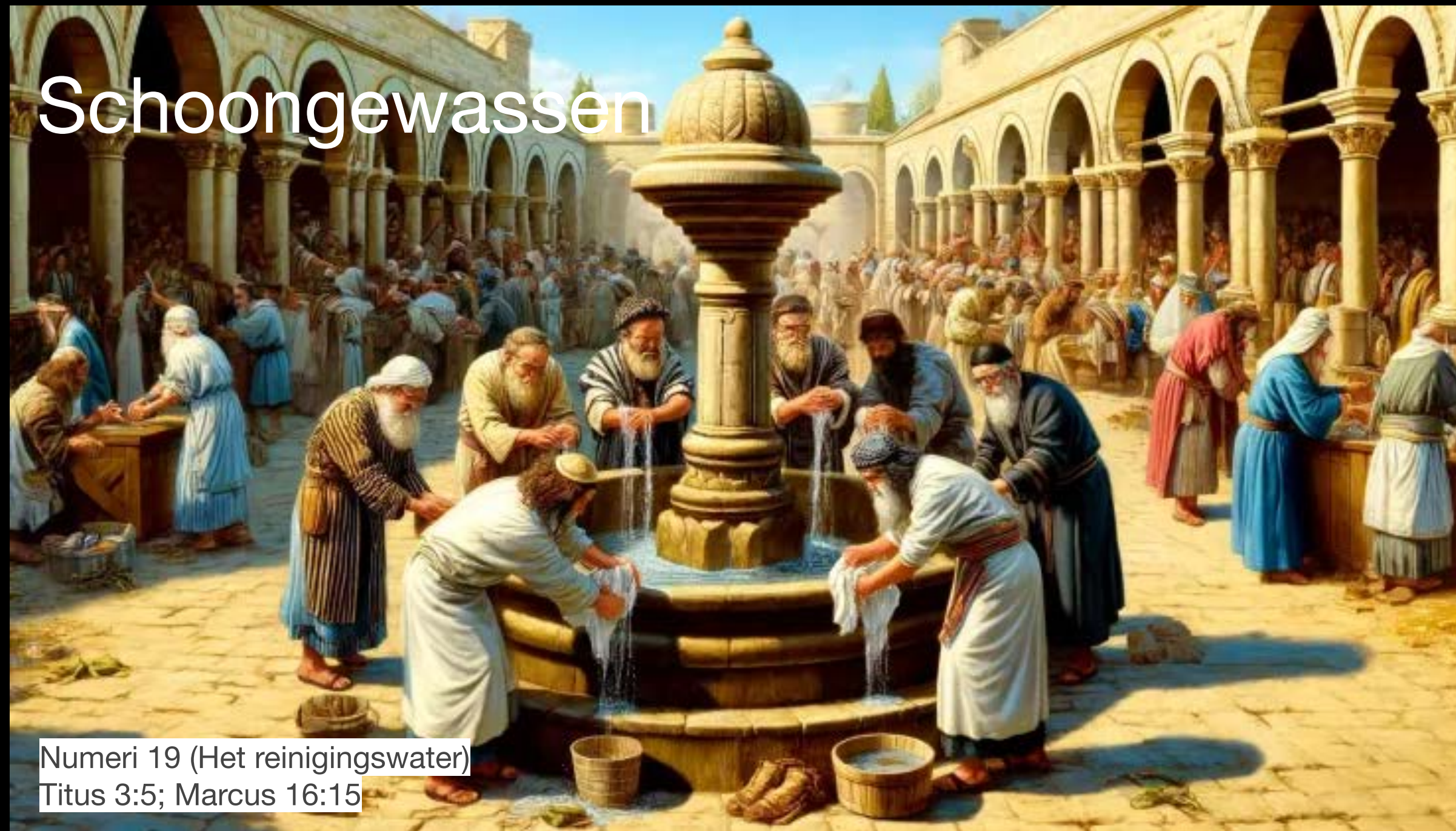
Numeri 19 (Het reinigingswater) Titus 3:5; Marcus 16:15