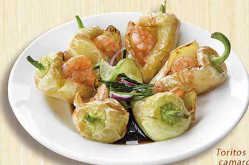
Toritos de camarón

Dip cremoso de camarón o marlín ahumado con apio, cebolla, mayonesa, media crema y un toque leve de chipotle. Servido con galletas saladas.