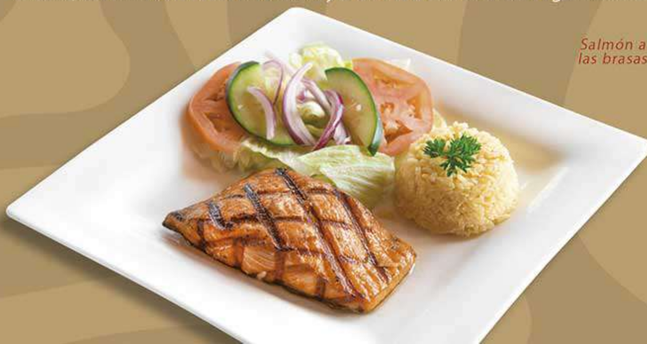
Salmón a las brasas

Filete grueso de pescado a la plancha, con un adobo de la casa a base de achiote, decorado con aros de cebolla y chile Anaheim cocinado ligeramente.