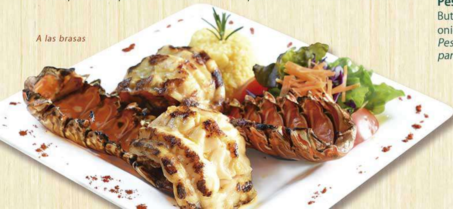
A las brasas

Colas de langosta preparadas a tu elección: a las brasas, al mojo de ajo o a la mantequilla. Siempre cocinadas al momento para resaltar su sabor natural.