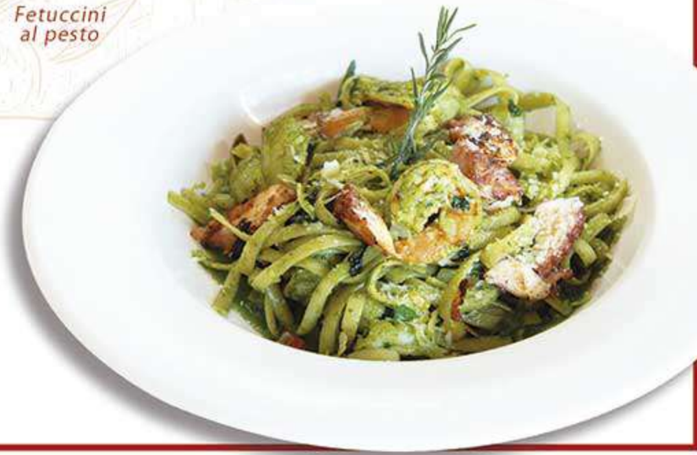
Fettuccini al pesto

Fettuccine pasta tossed in a creamy Alfredo sauce with your choice of shrimp or grilled chicken, finished with Parmesan cheese. Pasta fettuccini bañada en una cremosa salsa Alfredo, con tu elección de camarón o pollo a la parrilla, terminada con queso parmesano.