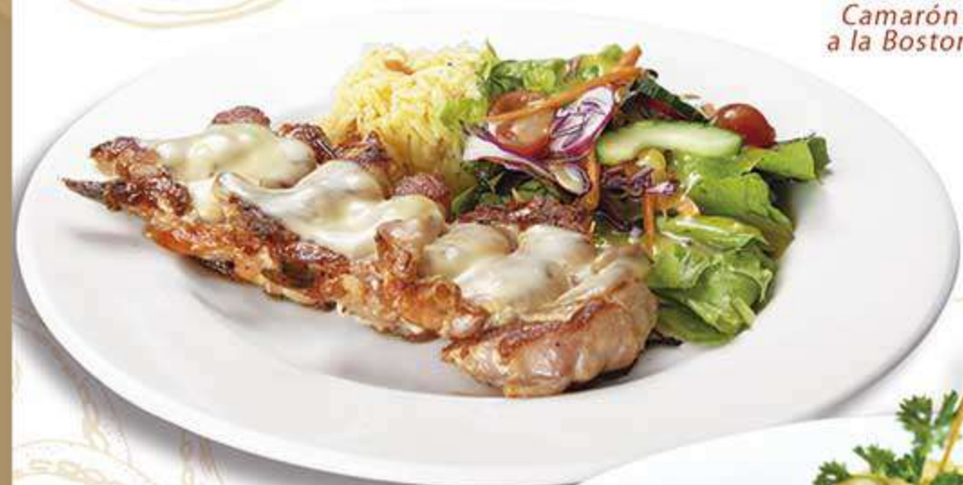
Camarón a la Boston

Camarones salteados en una cremosa salsa de chile poblano y gratinados con queso.