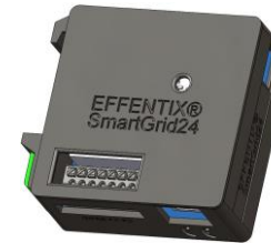
SmartGrid24 USB-C (5 V)