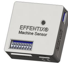
Machine Sensor USB-C (5 V)