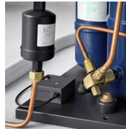
Machine Sensor USB-C (5 V)