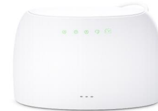
Router / LAN

Die 24-V-IN/OUT-Verdrahtung zur Anlagensteuerung ist anlagenspezifisch und nicht Teil dieses Leitfadens.