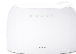
Router / LAN

Optional: Für höhere Ausfallsicherheit können WLAN und Ethernet parallel genutzt werden.