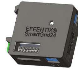
SmartGrid24 USB-C (5 V)