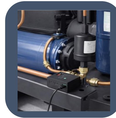
Sensor in Verdichternähe