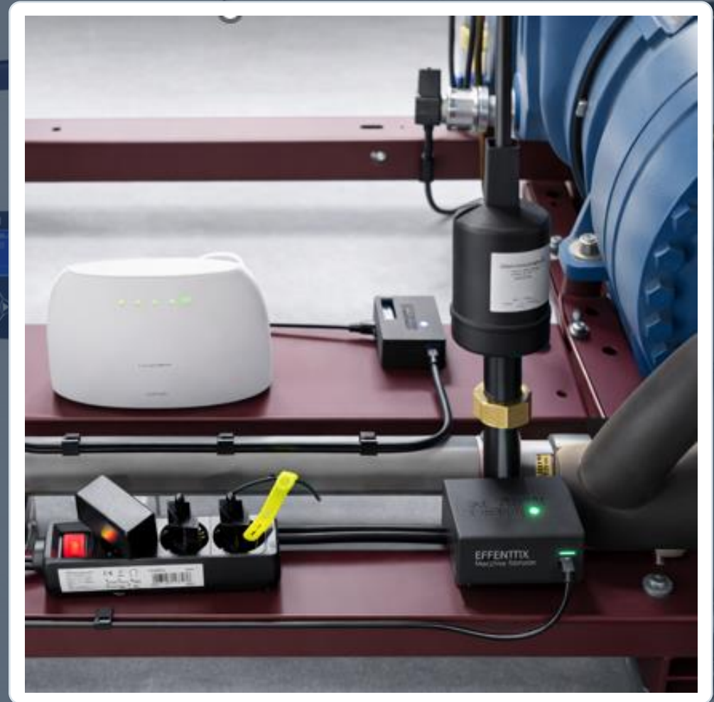
Beispielfoto: MachineSensor, SmartGrid24 und LAN-Netzwerk

Der Kunde montiert den Machine Sensor an einer schwingenden Metallfläche, verbindet ihn am SmartGrid24 und schließt das SmartGrid24 per Netzwerkkabel an den Router an.