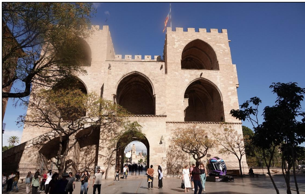
Torres de Serrano

Am 03,11,2024 brachte uns das Flugzeug nach Berlin zurück. Während unseres Aufenthaltes in Wien reflektierten wir das Erlebte. Wir waren uns einig, dass uns das Verhalten der Valencianer im Katastrophenfall besonders beeindruckt hatte. Ihre Bereitschaft