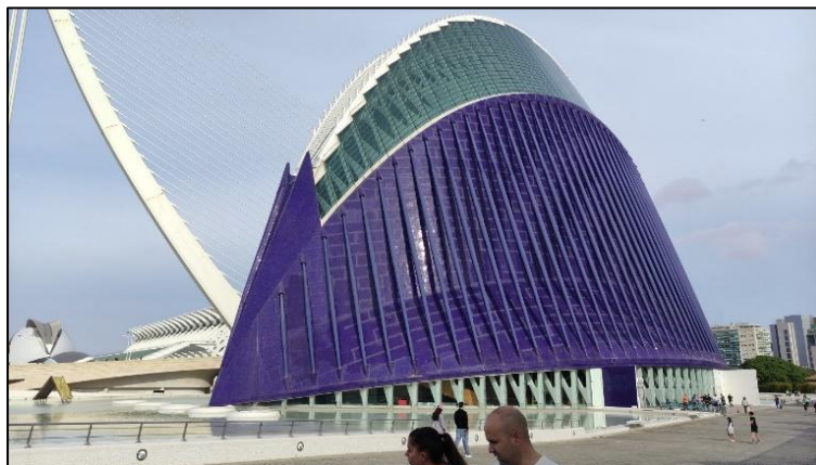
„Stadt der Kunst und der Wissenschaften“