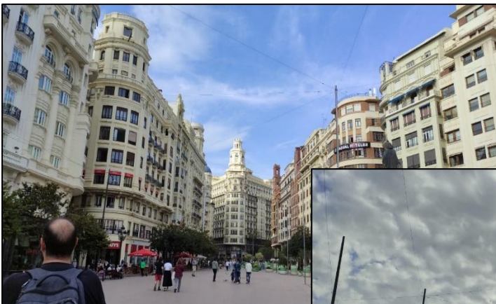
Historisches Zentrum von Valencia