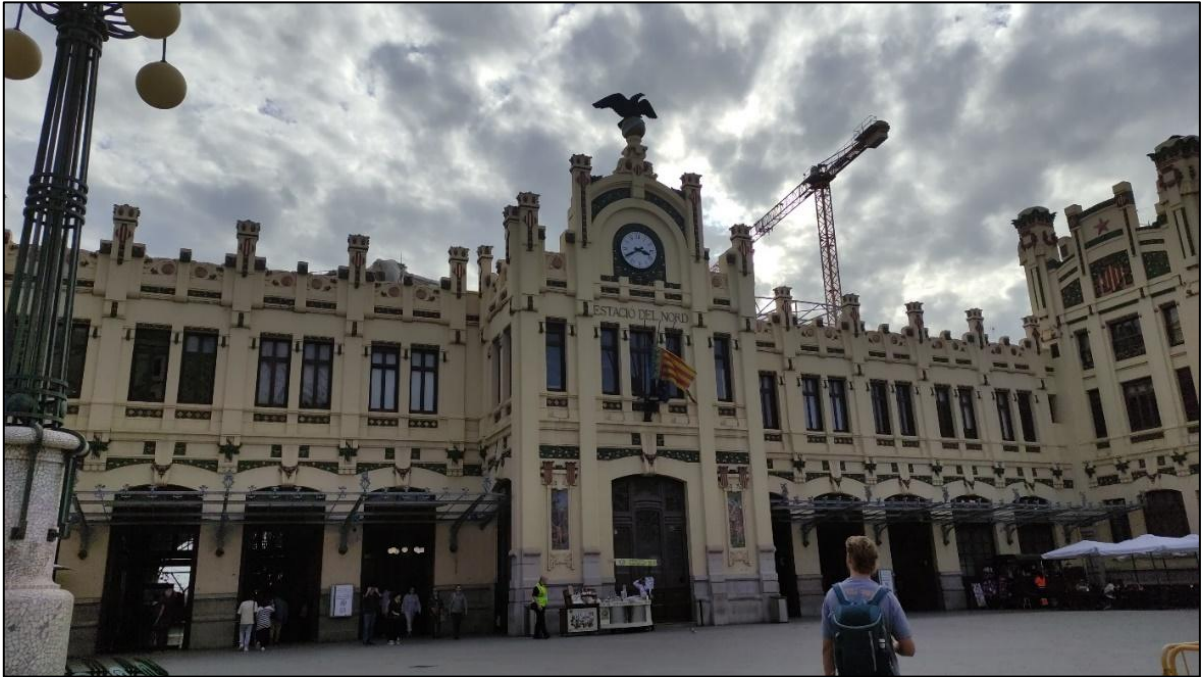
Estacion del Norte

Die Tour endete an der Kathedrale, diese besuchte die Gruppe im Anschluss. In der Kathedrale fand gerade eine Messe statt, viele von uns nahmen daran teil – ein sehr schöner und besinnlicher Abschluss nach dieser sehr informativen Führung.