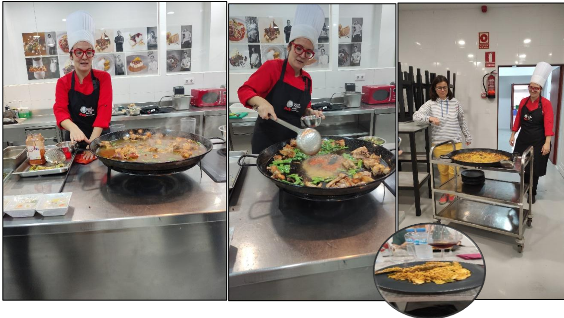
Kochstudio Meditarreño International

Über dem ältesten Viertel der Stadt, dem Barrio del Carmen im Norden erreichten wir den Jugendstilbahnhof Estacion del Norte im Süden. Er war der Ausgangspunkt für eine Stadtführung durch das historische Zentrum Valencias.