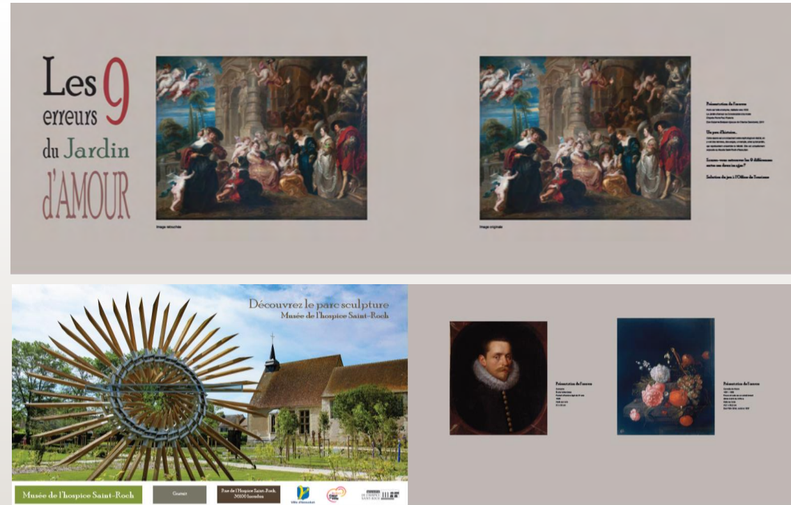
Vitrophanies sur commerce vacant, Place du 10 Juin, situé en plein Cœur de Ville d'Issoudun.