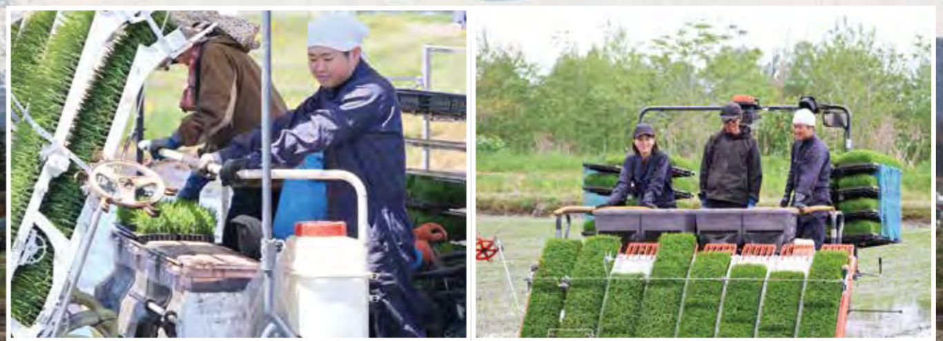
（株）松匠宅で田植え体験

JA北海道中央会研修生3名と当JA新入職員3名の現場研修を4月27日（月）から5月22日（金）まで実施しました。農協各部署における業務研修をはじめ田植え体験やサンチュの収穫体験など農業現場での実践的な研修を行いました。農作業体験した研修生は初めて経験することばかりで新鮮だった想いと、農家の皆さんの苦労や大変さを実感することができ、農業や地域への理解を深める貴重な機会となりました。