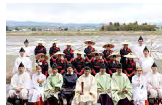
(中央) 北海道神宮間島宮司