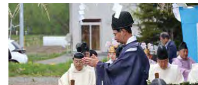
JA北海道中央会 小椋副会長