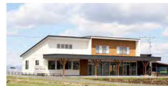
農村体験施設 みずにわテラス

5月11日（月）、第48回 北海道神宮神饌田御田植祭が「農村体験施設 みずにわテラス」にて執り行われました。5月1日（金）に開館したばかりのみずにわテラス完成後、初めての開催となり、東川町の豊かな自然に囲まれた会場の中で厳かな雰囲気のもと豊穡と農作業の安全が祈願されました。この北海道神宮神饌田で育まれたお米は、秋に執り行われる「新嘗祭」において北海道神宮へ奉納されます。