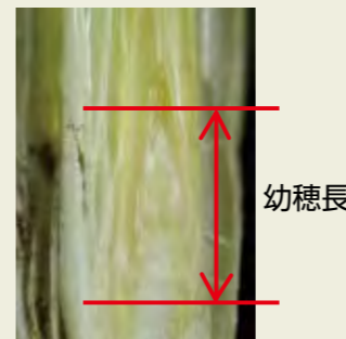
写真1 幼穂形成期の穂の姿(2mm)

幼穂形成期の確認から前歴期間・冷害危険期を判断します。平均的な生育の株の主茎(親穂)を3~5本程度抜き取り、カッターナイフ等で縦切りにして幼穂長を測ります。幼穂長が平均2mmに達した日が幼穂形成期です。