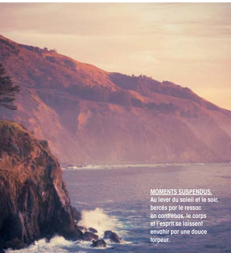
MOMENTS SUSPENDUS. Au lever du soleil et le soir, bercés par le ressac en contrebas, le corps et l'esprit se laissent envahir par une douce torpeur.