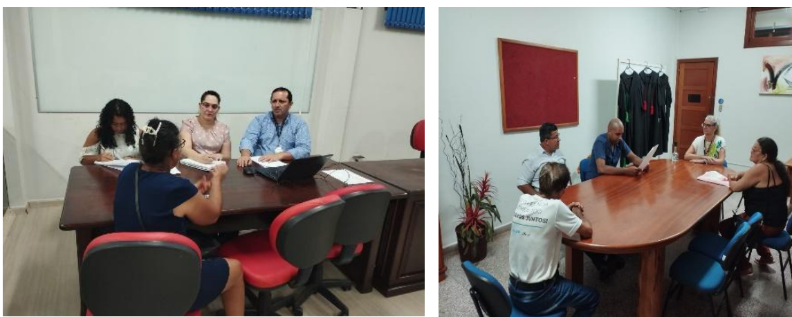
Figura 7 - Exemplos de participação de dos acadêmicos do curso de Direito do Centro Universitário São Lucas Ji-Paraná em produções de peças e atendimentos no NPJ.