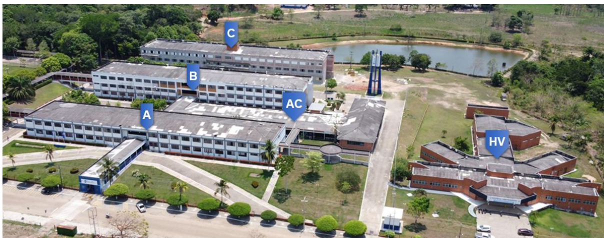
Figura 15 - Foto Aérea e Panorâmica do Campus SÃO LUCAS JPR.

Legenda: A (Prédio A), B (Prédio B), C (Prédio C), AC (Área de Conveniência) e HV (Clínica Veterinária)