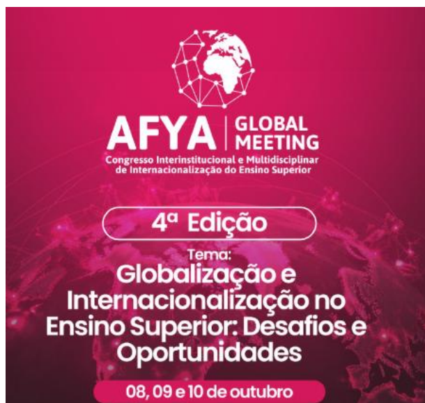
Figura 14 - 4º Afya Global Meeting

O 4º Afya Global Meeting foi organizado afim de contextualizar a internacionalização como um princípio formativo no desenvolvimento de estudantes e professores, que promovem o conhecimento, a formação integral e multicultural com excelência acadêmica, nos níveis de ensino, pesquisa e extensão.