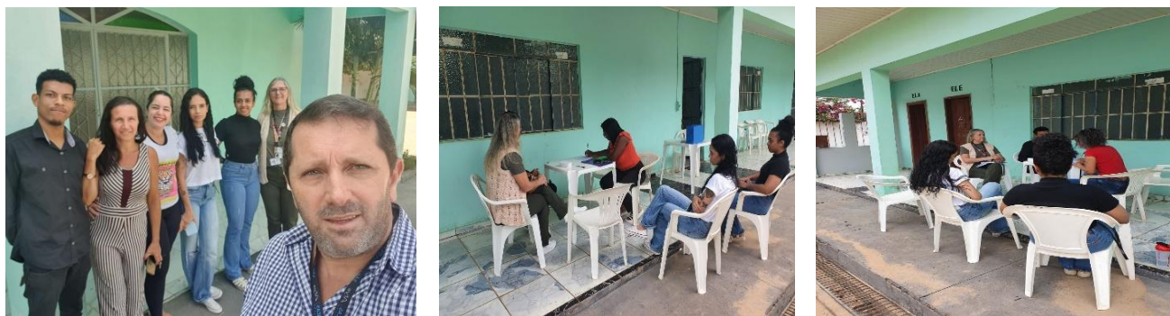
Figura 10 - Registros fotográficos dos atendimentos jurídicos da ação itinerante realizada no dia 25 de maio de 2024.

Na data de 25 de maio de 2024, os estagiários realizaram mais um atendimento externo gratuito para a população, atendimento realizado em parceria com a Comunidade Santo Antônio, onde os acadêmicos puderam orientar o público sobre questões jurídicas.