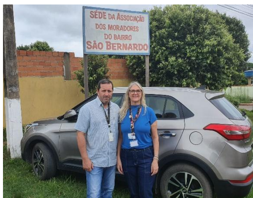
Figura 5 - Exemplos de participação de dos acadêmicos em atendimento itinerante realizado no semestre letivo 2024/1.

No ano letivo 2024, foram realizados 161 atendimentos, tendo ocorrido atendimentos no NPJ de forma presencial e atendimentos itinerantes realizados na Associação de Moradores do Bairro São Bernardo, Associação de Pais e Amigos dos Excepcionais – APAE, Comunidade Santo Antônio, OAB/Subseção de Ji-Paraná, SESC Clementina, Comunidade Indígena ARARA e Comunidade Nossa Senhora Aparecida.