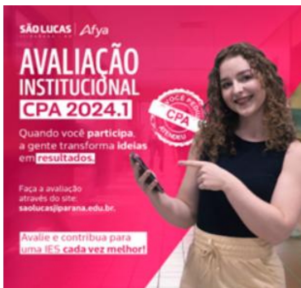
Figura 1 - Campanha de participação da avaliação institucional 2024.1

Para efetivação da fase de coleta de dados da Campanha de Avaliação Institucional 2024, a CPA publicou pôsteres (com link e qr-Code) no site da IES, em redes sociais, no portal do aluno e nos grupos de WhatsApp.