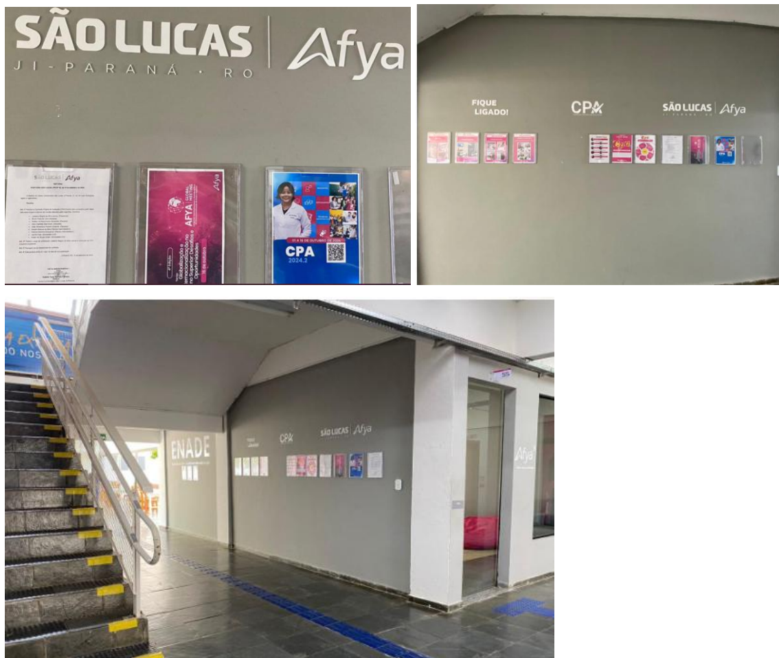
Figura 3 - Campanha de participação da avaliação institucional 2024.2