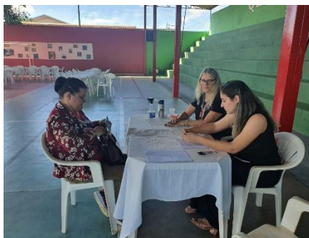
Figura 9 - Registros fotográficos do atendimento jurídico gratuito no dia 26 de abril de 2024