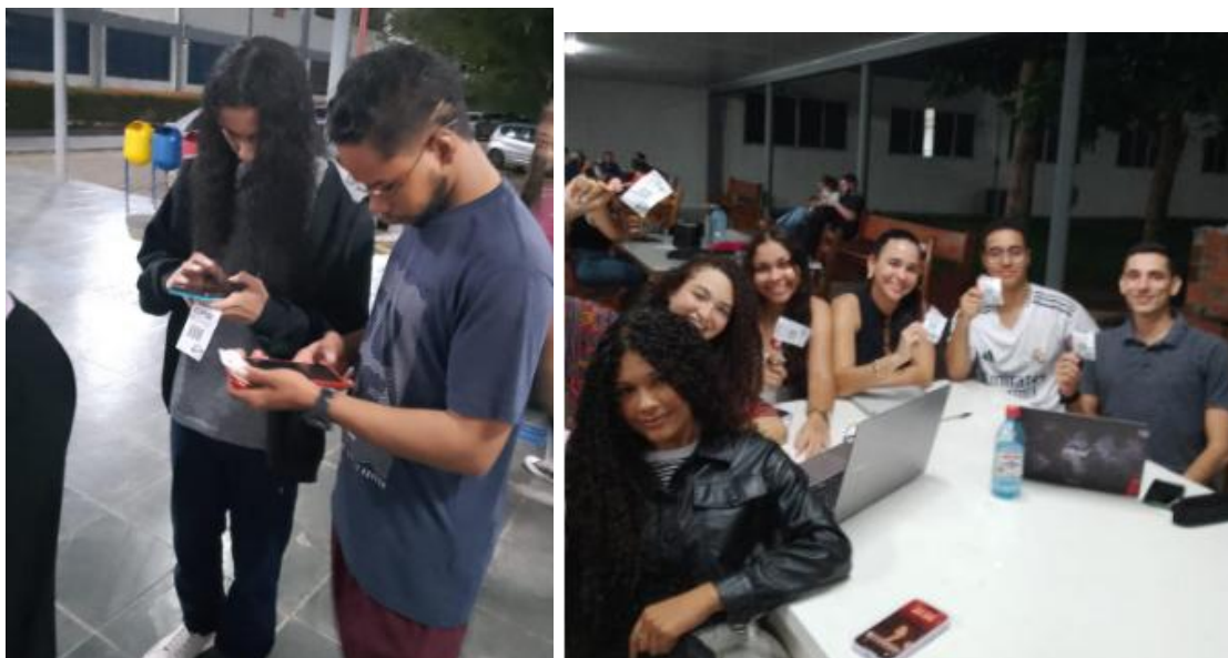
Figura 4 - Campanha de participação da avaliação institucional 2024.2