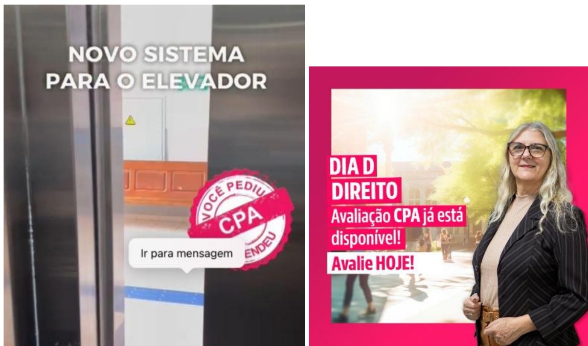
Figura 2 - Campanha de participação da avaliação institucional 2024.1