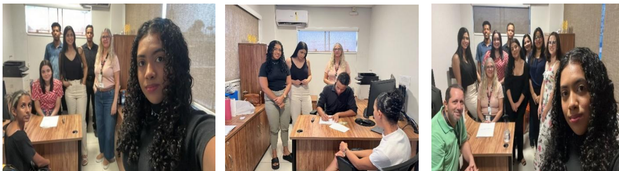
Figura 12 - Registros fotográficos do evento em SESC Clementina, em 24 de agosto de 2024.

No dia 24 de agosto de 2024, os acadêmicos do curso de Direito prestaram de atendimento jurídico gratuito à comunidade, o qual fora realizado no SESC Clementina, onde foram realizados 7 atendimentos.