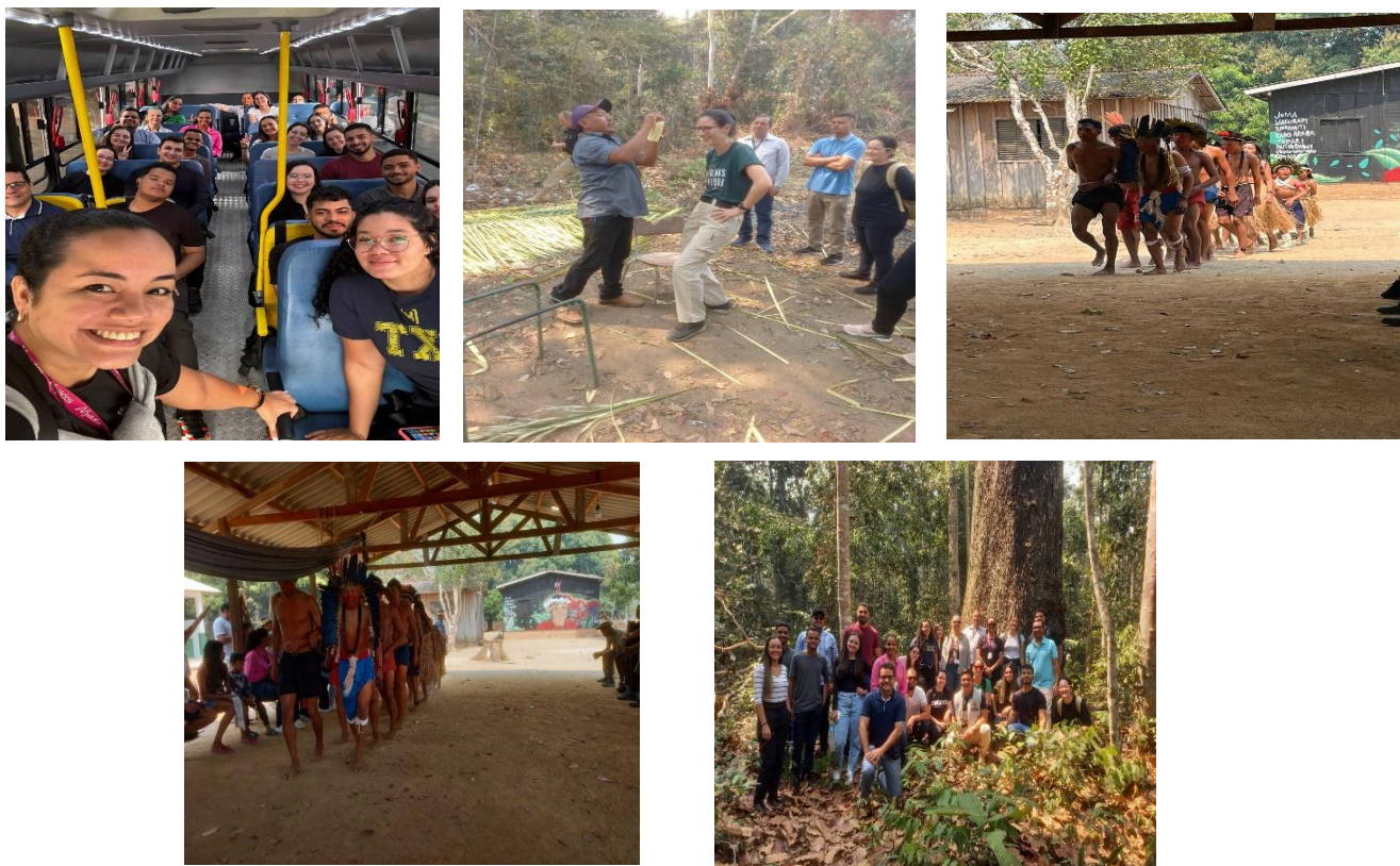
Figura 13 - Registros fotográficos de visita à Comunidade Indígena ARARA, em 28 de agosto de 2024.