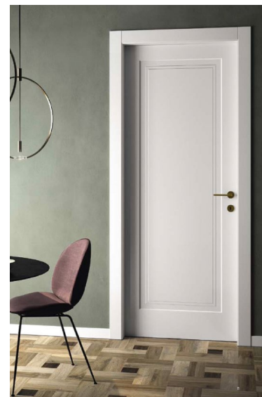
Porta e maniglia attici