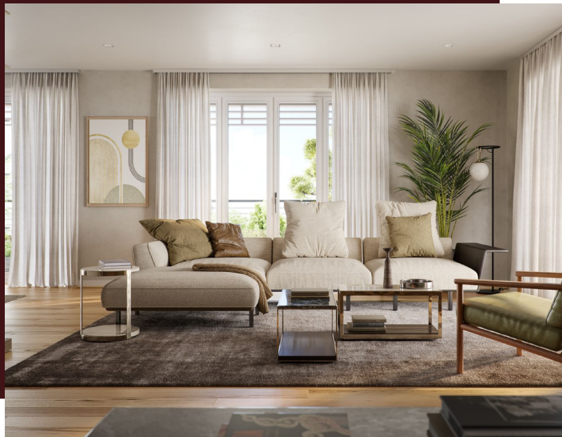
Porta e maniglia appartamenti