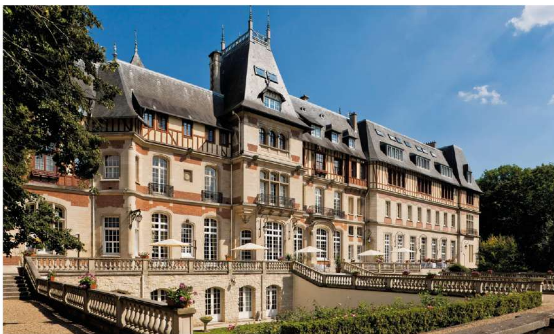
@369 DEGRÉS HÔTELS ET MAISONS

Nel cuore della foresta di Chantilly, a meno di un'ora da Parigi, rinasce uno dei luoghi più affascinanti della regione: lo Château de Montvillargenne, oggi trasformato nel raffinato hotel Jeanne & the Forest . Un progetto ambizioso guidato dal gruppo 369° Hotels et Maisons, che restituisce nuova vita e identità a quello che è il più grande château-hotel di Francia, senza tradirne l'anima storica. La ristrutturazione, firmata dall'interior designer Chantal Peyrat, fonde infatti la sontuosità della Belle Époque con l'eleganza sobria del design contemporaneo.