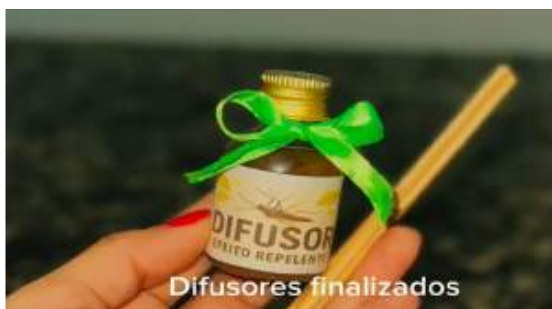
Figura 3 - Difusores aromáticos com efeito repelente, utilizando materiais recicláveis e insumos naturais reaproveitados.