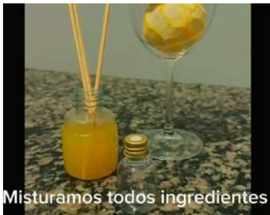
Figura 1 - Produção dos difusores aromáticos com ação repelente, confeccionados pelos acadêmicos utilizando materiais recicláveis e insumos naturais.