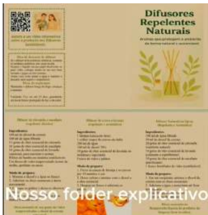
Figura 2 - Folder explicativo produzido pelos estudantes contendo orientações sobre a preparação dos difusores aromáticos repelentes e dicas de uso sustentável dos materiais.