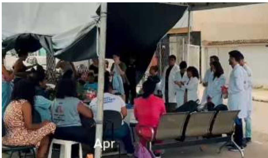
Figura 4 - Apresentação do trabalho realizado pelos acadêmicos para a comunidade, compartilhando orientações e promovendo educação em saúde.

Duque de Caxias – RJ, 23 de novembro de 2025.