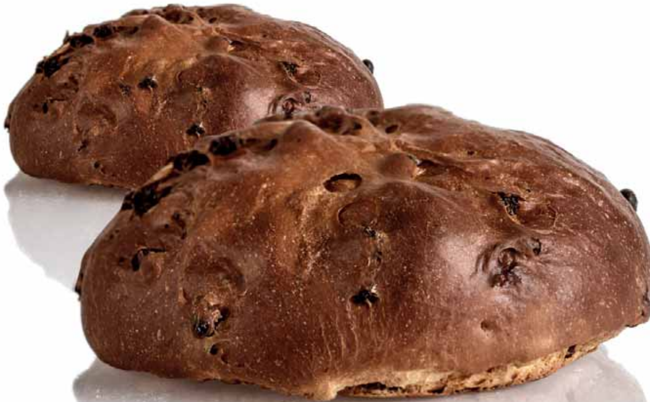
Pan de' Santi 500 g cod. 740

Il Pan de' Santi è un antichissimo dolce lievitato che veniva preparato nelle spezierie e farmacie medioevali, in occasione delle feste dei primi di novembre (dei Santi e dei Morti). Gli ingredienti principali sono: zucchero, farina, noci, uvetta e spezie.