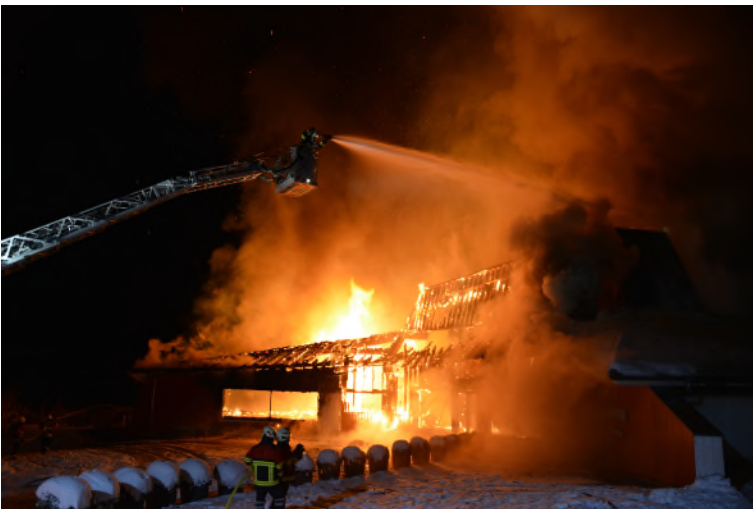
Die ADL unterstützt eine benachbarte Feuerwehr beim Löscheinsatz eines Hofes