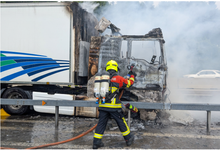
Ein Eingeteilter des Atemschutzes beim Löschen eines Lastwagens auf der Autobahn