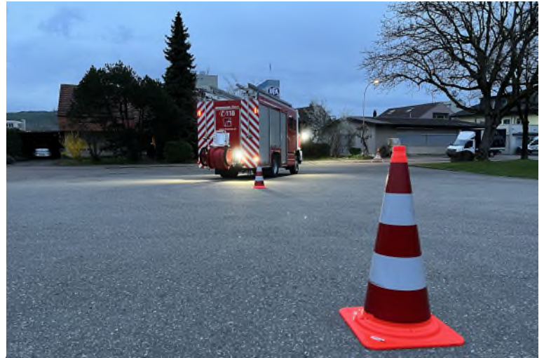
Die Fahrer/Maschinisten üben das Rückwärtsfahren mit dem Tanklöschfahrzeug