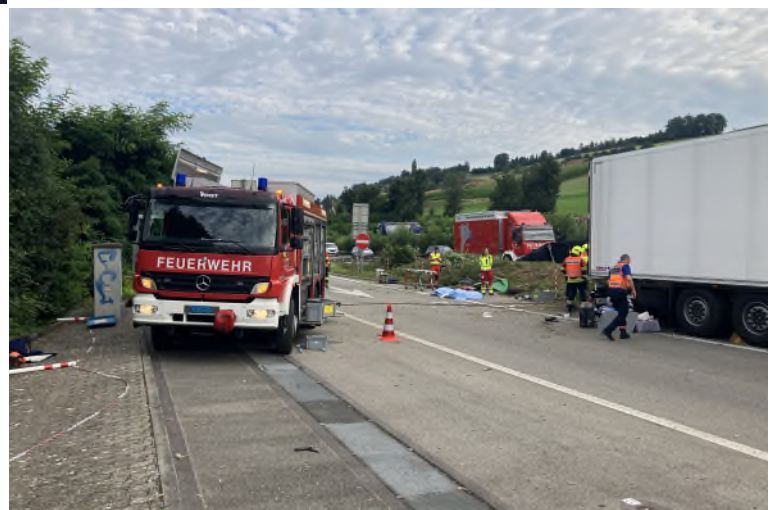
Der Fachbereich PbU bei einem Verkehrsunfall auf der Autobahnraststätte