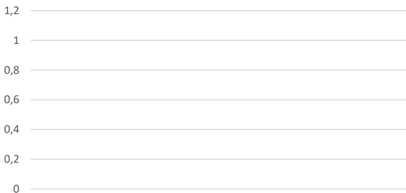
Gráfico 03 - Formas de Atendimento

A Instituição permanece em alerta quanto ao crescimento dos problemas ainda existentes na Afya Faculdade Porto Nacional.