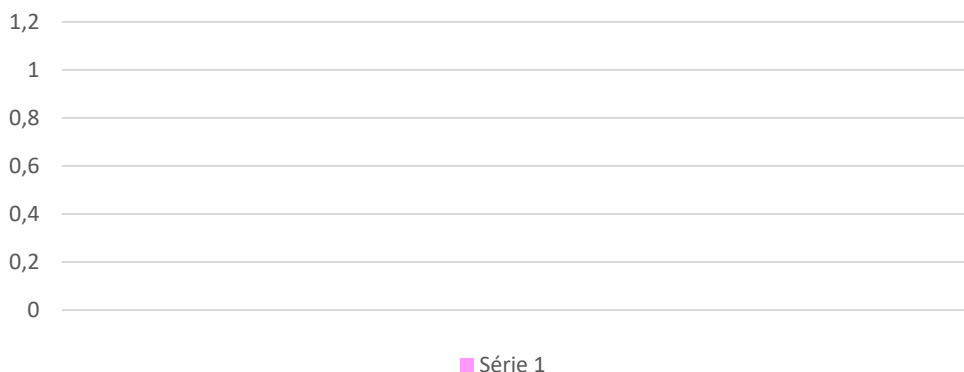
Gráfico 02 - Número de manifestações registradas por setor | Responsável no mês de setembro.

Dos meios de acesso utilizados para entrar em contato com a Ouvidoria é por meio da plataforma Contato Seguro , conforme demonstra o Gráfico 3, como não houve nenhum relato, o gráfico está sem dados.