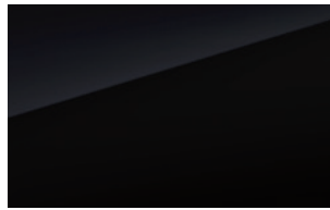
Polar Night Black