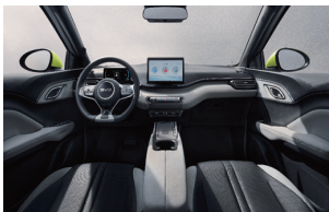
Black and Grey