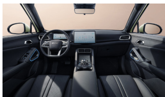
Black (Boost & Active)