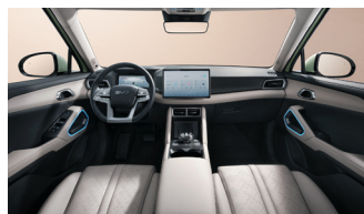
Beige (Boost & Active)