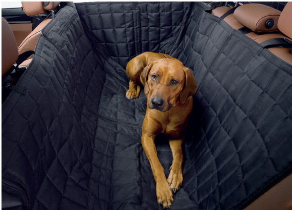
Schondecke für die Rückbank