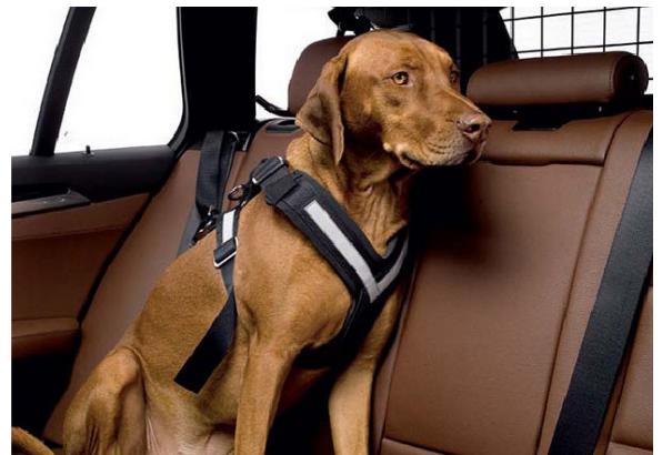
Sicherheitsgurt für Hunde