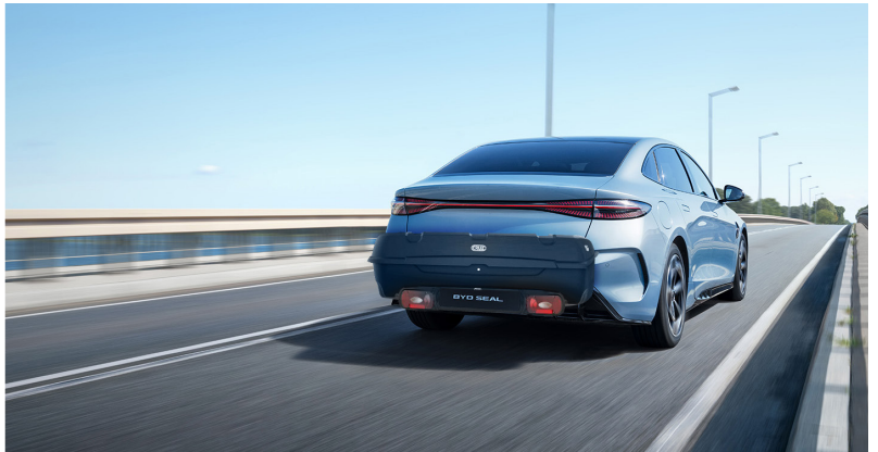
Heckträger mit Heckbox