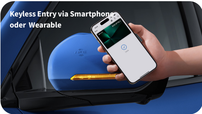
Keyless Entry via Smartphone oder Wearable