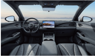
Blau und schwarz