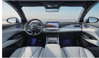
Schwarz und grau