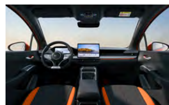
Black & Orange (Variante Sport)