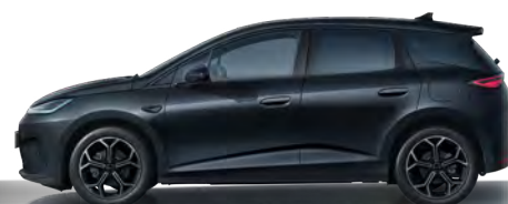
Obsidian Black (Variante Comfort, 18" Aluminiumfelgen)