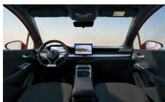
Black (Variante Active)