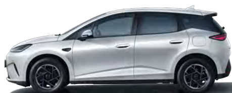
Skiing White (Variante Active, 16" Aluminiumfelgen)