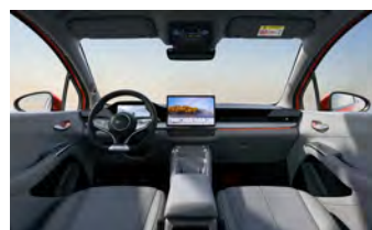
Ocean Grey (Variante Comfort)