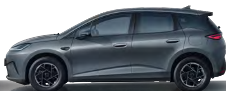
Time Grey (Variante Boost, 16" Aluminiumfelgen)