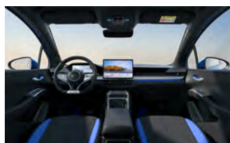
Black & Blue (Variante Sport)