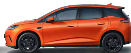
Orange Sunset (Variante Sport, 18" Aluminiumfelgen schwarz)