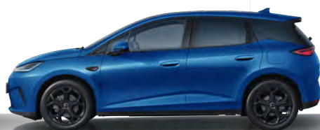
Ocean Blue (Variante Sport, 18" Aluminiumfelgen schwarz)