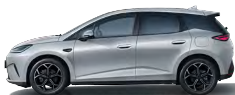
Oxford White (Variante Comfort, 18" Aluminiumfelgen)