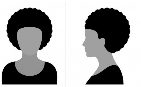
Figura 1. Foto frontal