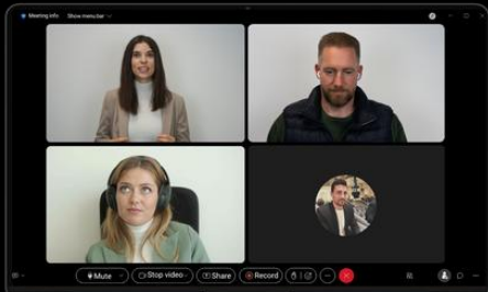
Unklare nonverbale Hinweise