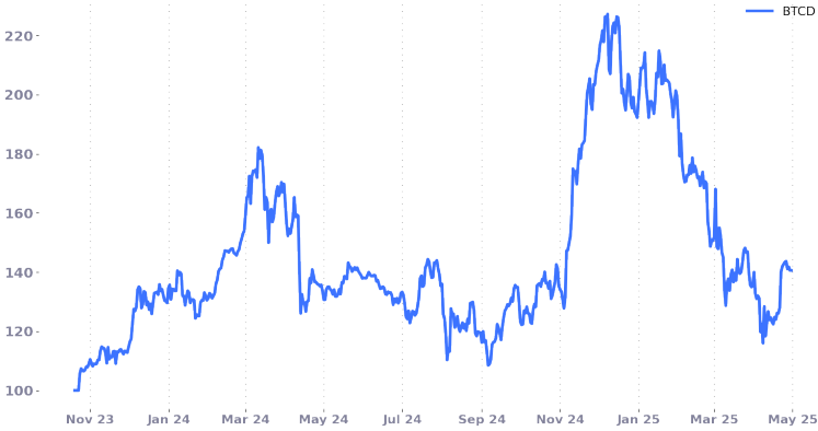
Absolute Rendite (%) von FiCAS Dynamic Crypto ETP (abzüglich Gebühren).

Unterdessen bekräftigte Grayscale seinen Antrag auf Zulassung eines Ethereum-Staking-ETFs, während die SEC weiterhin regulatorische Rahmenbedingungen für stakingspezifische Produkte prüft. Zugleich bestätigte Morgan Stanley, künftig Krypto-Handel über E*Trade anzubieten, ein weiterer Schritt in Richtung einer vertieften Integration digitaler Vermögenswerte in das US-Finanzsystem.