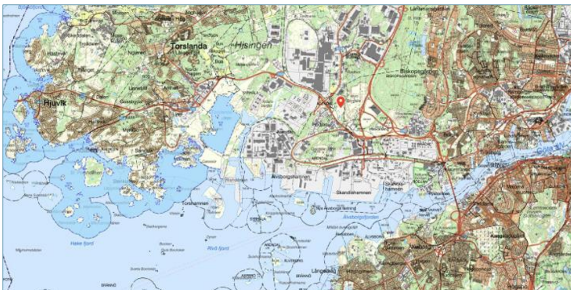
Översiktlig lokalisering av verksamheten (röd knappnål).