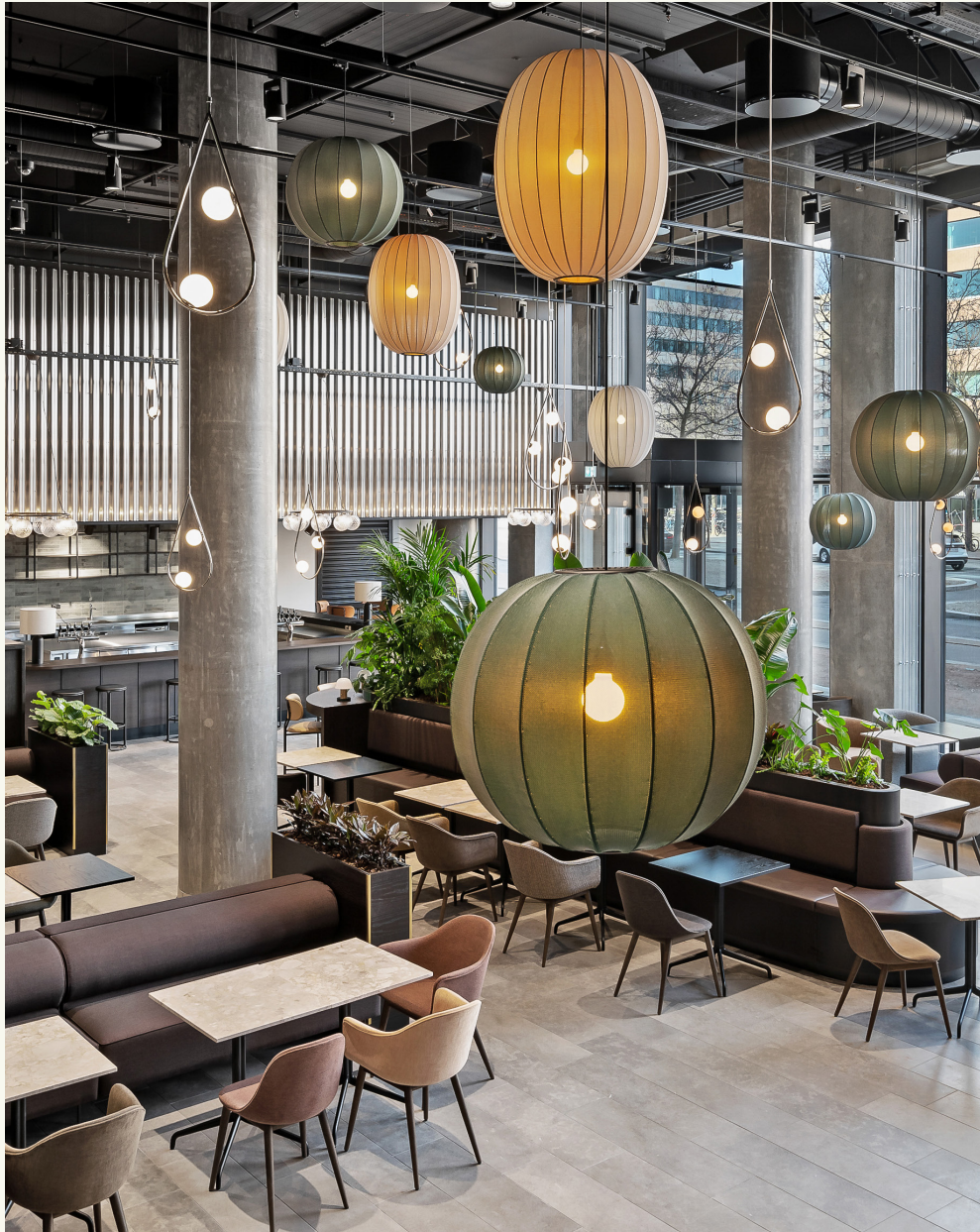
Eventspace: 80 personer