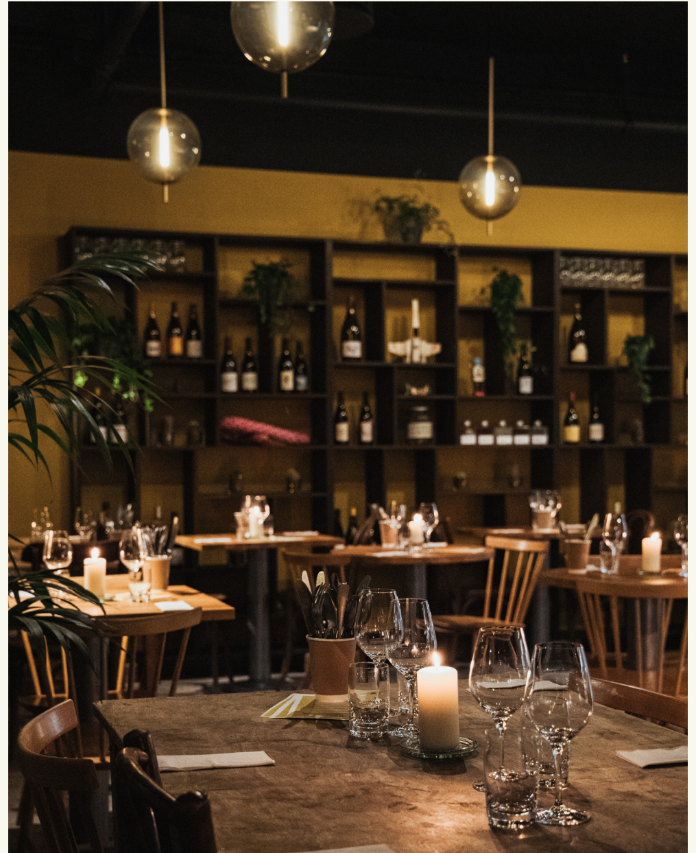
Restaurant: 50 personer