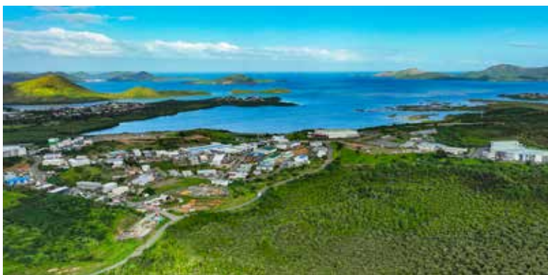
À Dumbéa, la ZAC Panda tente progressivement de retrouver son rythme après les émeutes de 2024.