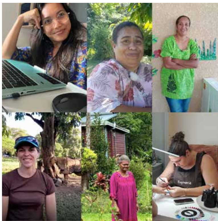
L'Adie met à l'honneur plusieurs femmes entrepreneuses du territoire.

Les formats sont tout aussi variés. Des «cafés des entrepreneuses» où des clientes de l'Adie témoignent de leur parcours dans la couture, la restauration ou le commerce de quartier, des réunions d'information collectives avec des associations féminines locales, des mises en relation avec des partenaires sur des secteurs porteurs. Mercredi, l'Adie était notamment à Auteuil pour mettre en lien des porteurs de projets dans les métiers de bouche avec des laboratoires professionnels permettant de tester une activité avant d'investir dans un espace dédié. Jeudi, le temps fort de