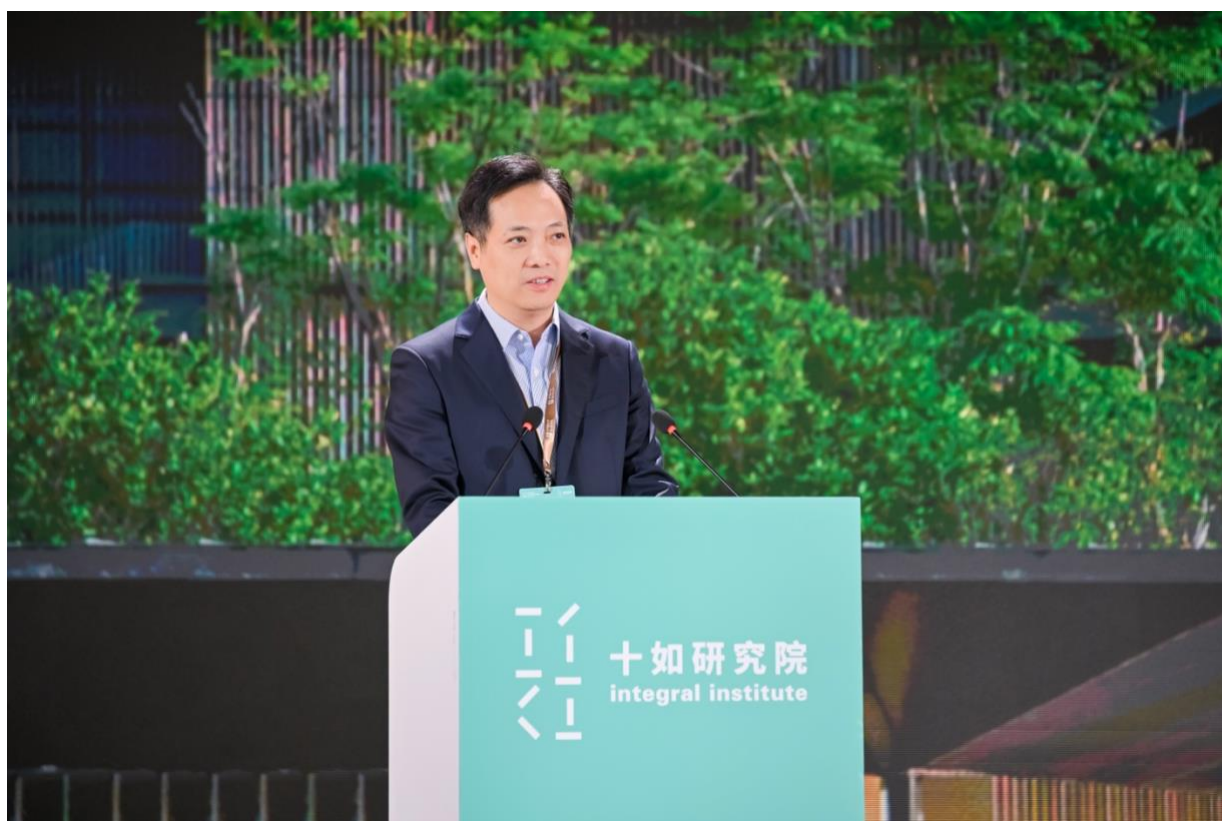
桂林市委副书记孙环志先生致辞。

桂林市委副书记 孙环志 先生在开幕式上致辞，肯定十如研究院在推动桂林及更广泛区域可持续发展交流与合作的积极贡献。他表示：“十如为桂林产业绿色可持续发展树立了典范，本次十如对话主题与桂林建设世界级旅游城市、探索工业绿色发展路径十分契合，为桂林可持续发展注入更多理念和动能。”