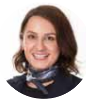
Nefize Can Business Circle