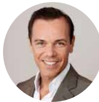
Gerhard Pichler Business Circle