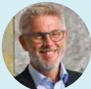
Tobias Keber Landesbeauftragter für Datenschutz Baden- Württemberg