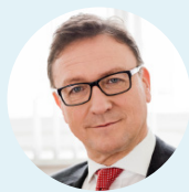
Helmut Ettl Finanzmarktaufsicht