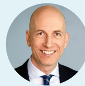
Martin Kocher Österreichische Nationalbank