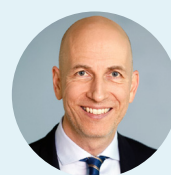
Martin Kocher Österreichische Nationalbank