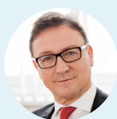
Helmut Ettl Finanzmarktaufsicht