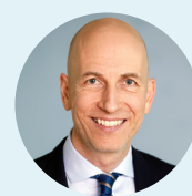
Martin Kocher Österreichische Nationalbank