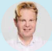
Moritz Mirascija Business Circle