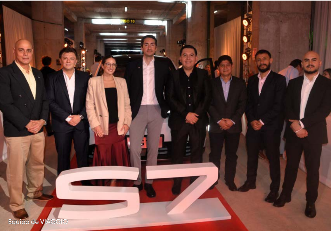
Equipo de VIAGGIO