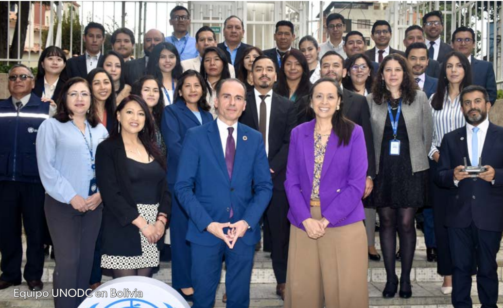
Equipo UNODC en Bolivia