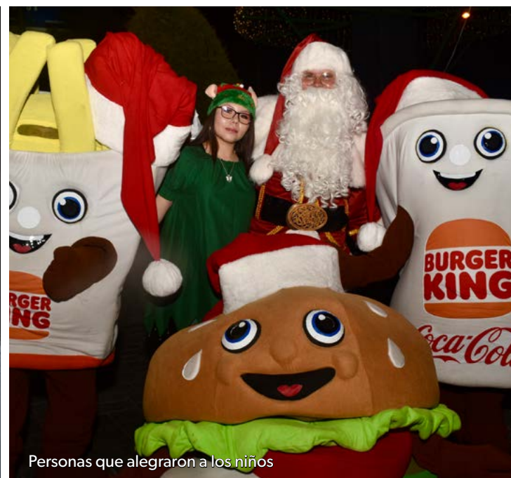
Personas que alegraron a los niños