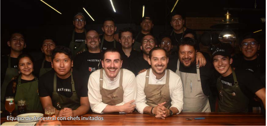
Equipo de Ancestral con chefs invitados