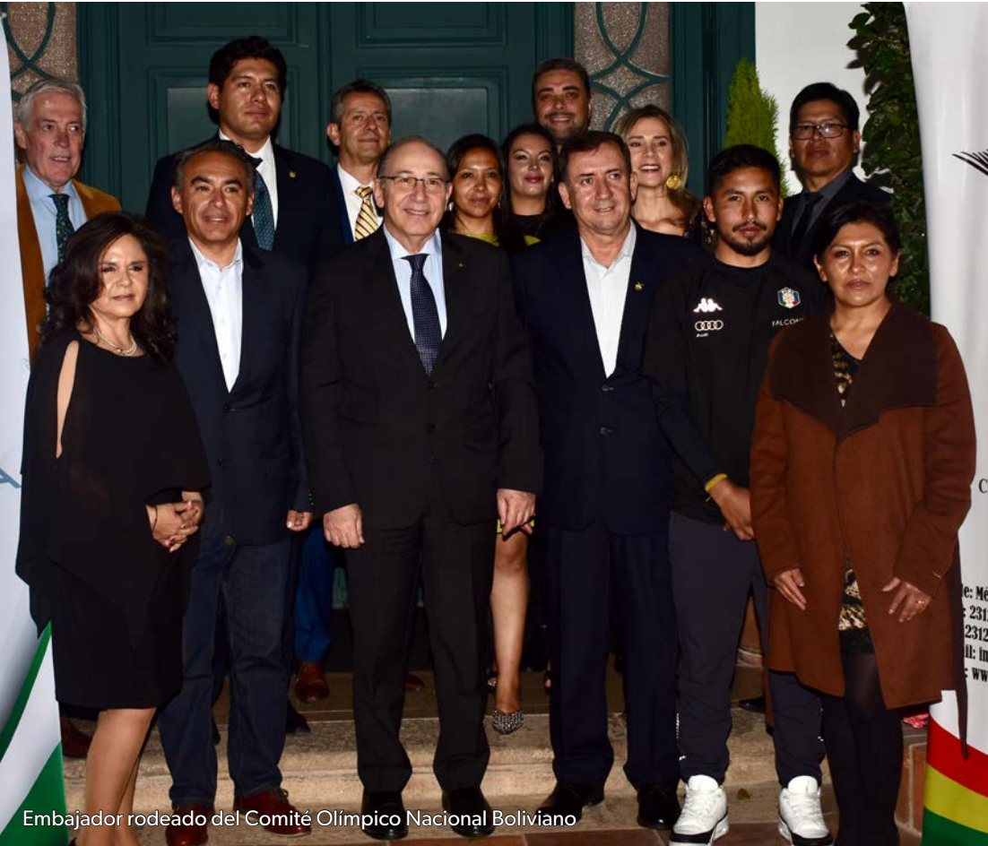
Embajador rodeado del Comité Olímpico Nacional Boliviano

Durante el encuentro se compartieron palabras de aliento dirigidas a los deportistas, resaltando el compromiso, la disciplina y el orgullo de portar los colores de Bolivia en una competencia de alcance mundial. Asimismo, el evento permitió fortalecer los lazos diplomáticos entre Bolivia e Italia, reafirmando el valor del deporte olímpico como un puente de integración y cooperación entre ambos países.