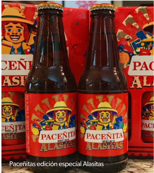
Paceñitas edición especial Alasitas