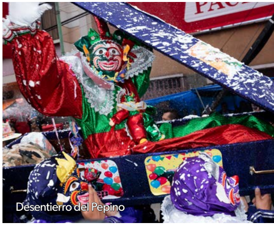
Desentierro del Pepino