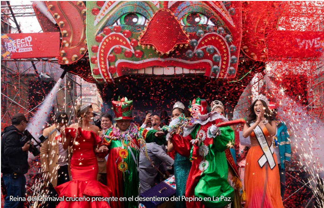
Reina del Carnaval cruceño presente en el desentierro del Pepino en La Paz