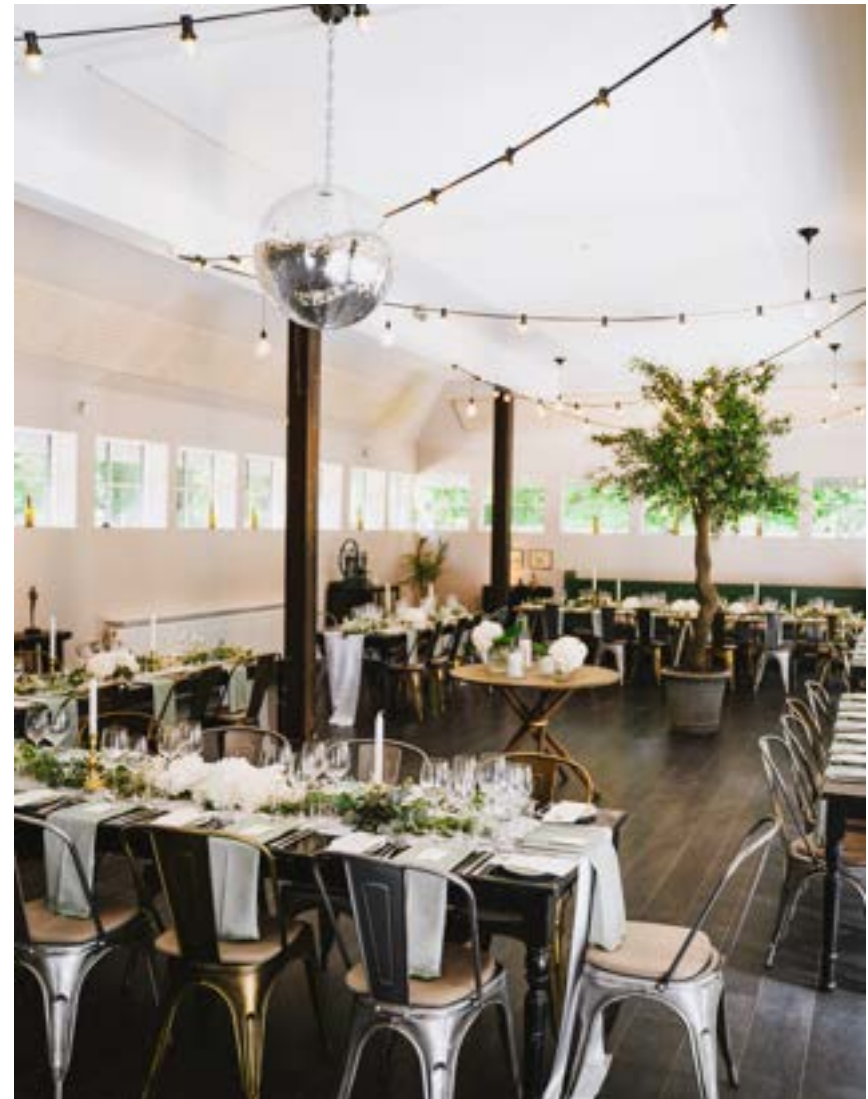
Havestuen kapacitet: 50-100 personer