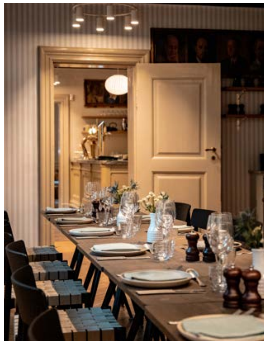
Restauranten kapacitet: 30-45 personer