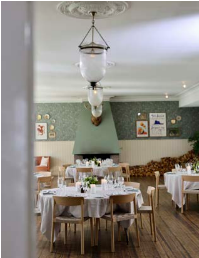
Pejsesalen kapacitet: 50-150 personer

Peter Liep's Hus er stolt af sine flotte selskabslokaler med plads til både store og små selskaber.