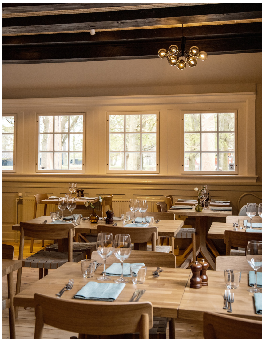
Restauranten kapacitet: 30-45 personer