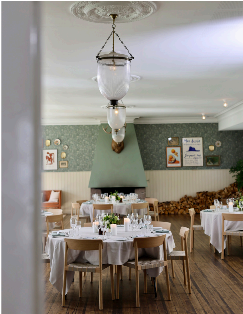
Pejsesalen kapacitet: 50-150 personer

Peter Liep's Hus er stolt af sine flotte selskabslokaler med plads til både store og små selskaber.