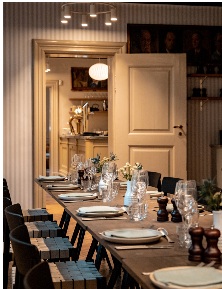
Restauranten kapacitet: 30 personer