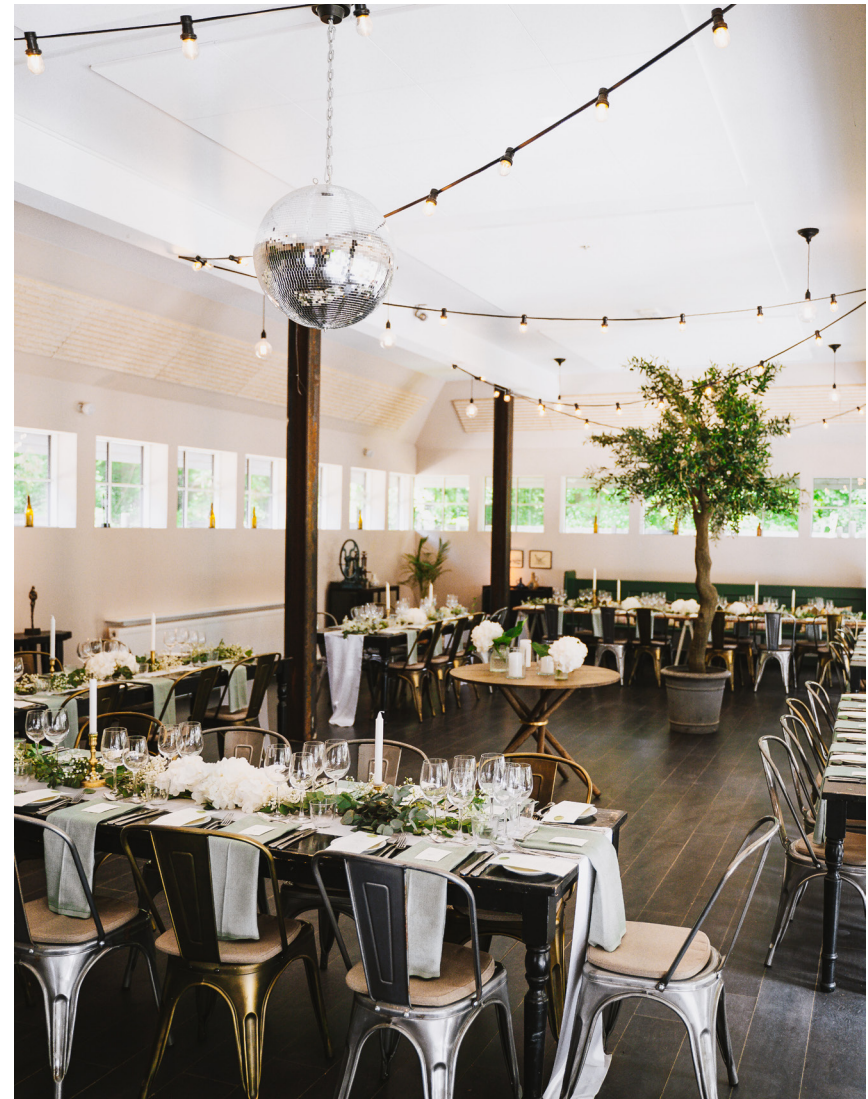
Havestuen kapacitet: 50-100 personer