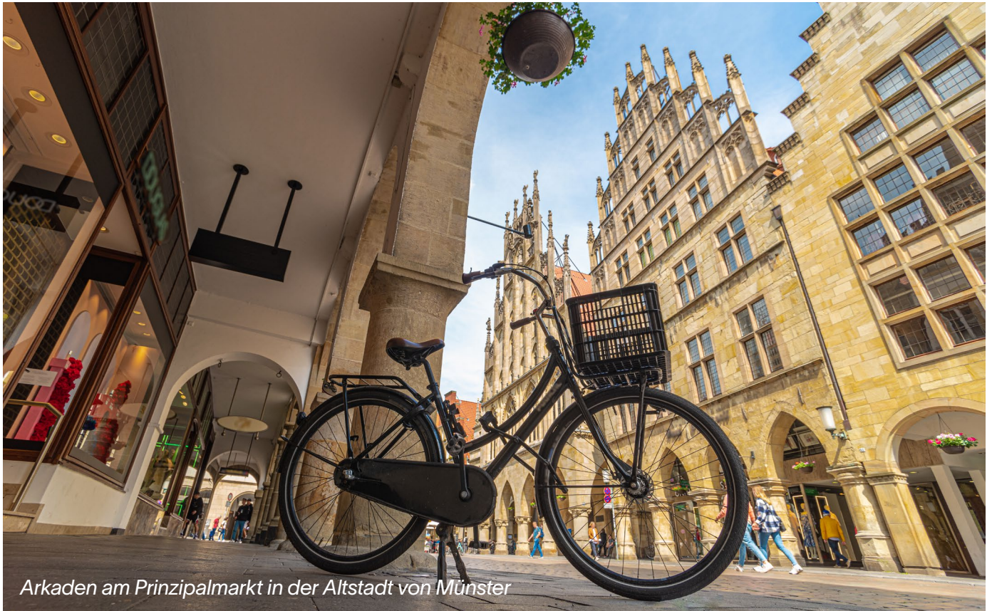
Arkaden am Prinzipalmarkt in der Altstadt von Münster