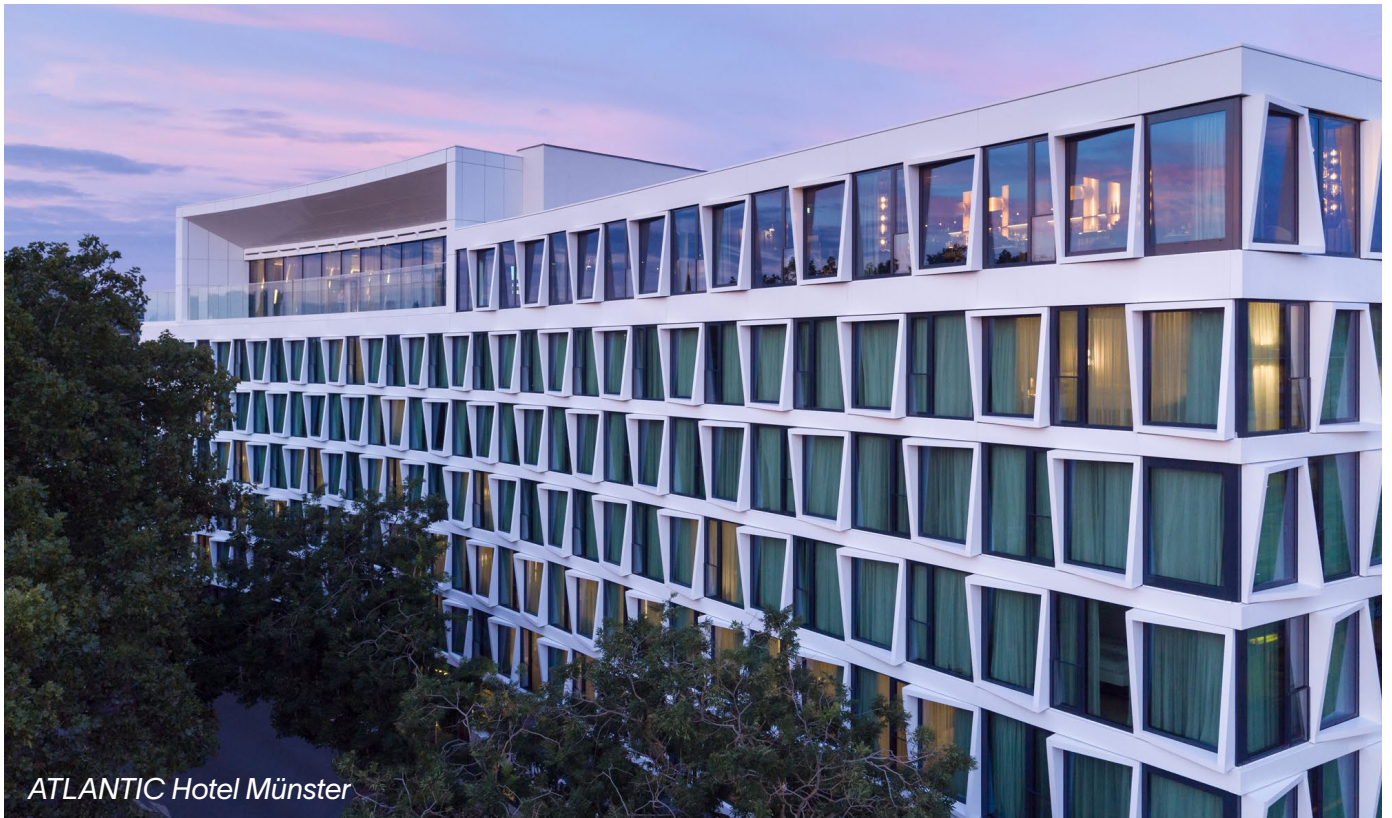
ATLANTIC Hotel Münster