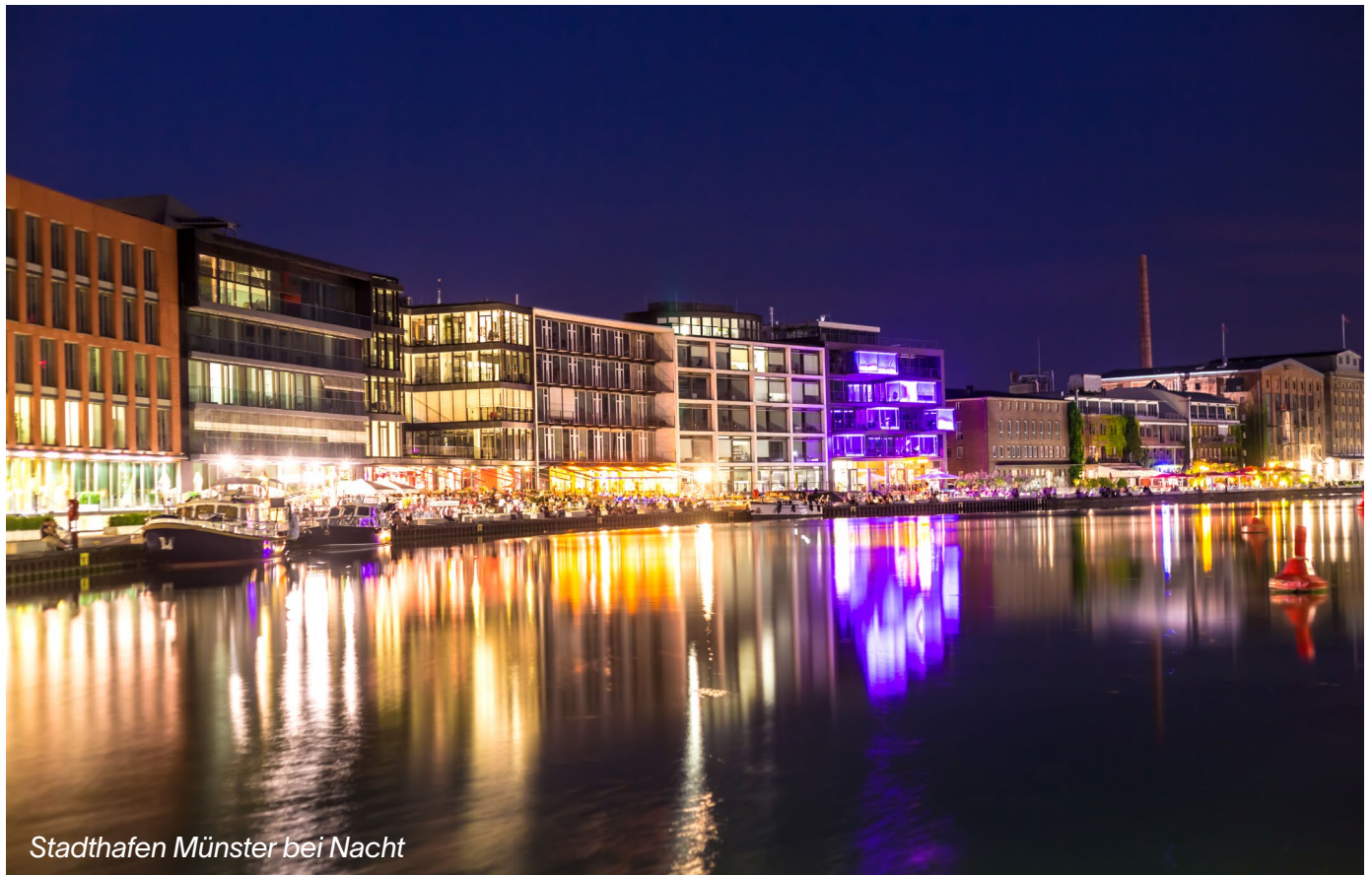
Stadthafen Münster bei Nacht